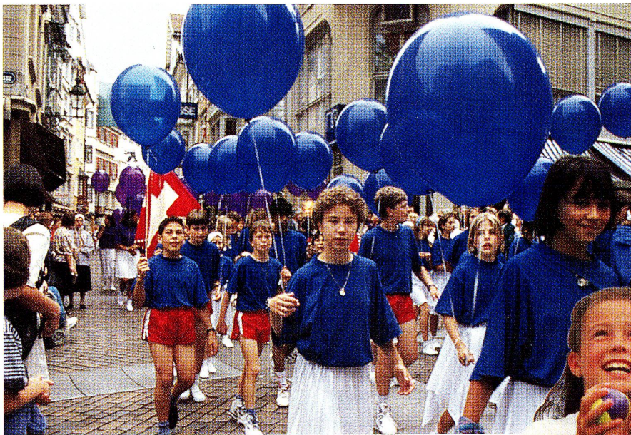
Wetterglück für Kinderfest. «Kinder und Blumen» – so das diesjährige Motto – kamen voll zur Geltung.