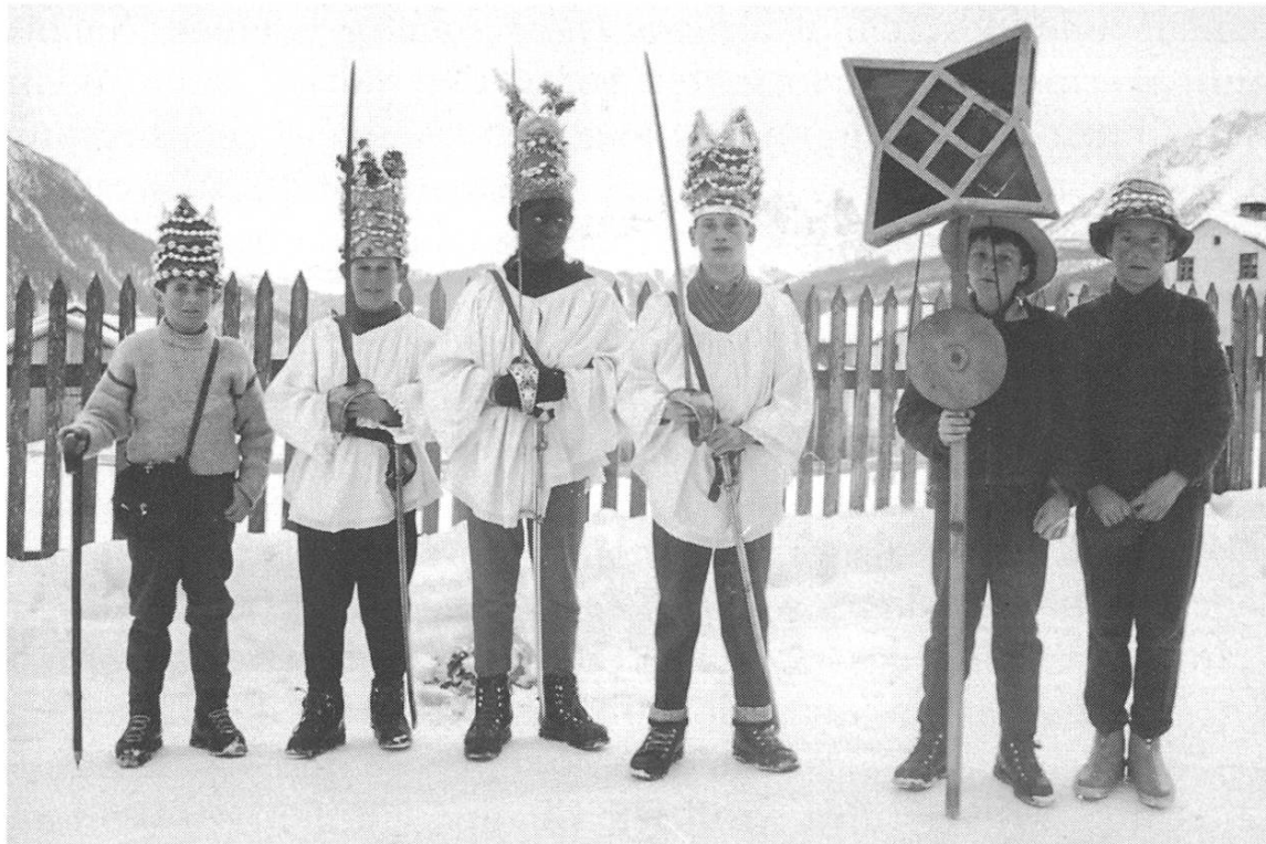
Lantsch 6.1.1963. Die Drei Könige, die zwei Sternträger, der Säckelmeister.

Ein Vergleich beider kurz beschriebenen Bräuche wäre verlockend! Wenn in Breil droben die Rechte der Könige (allgemein gesprochen werden alle Darsteller Könige genannt) mit