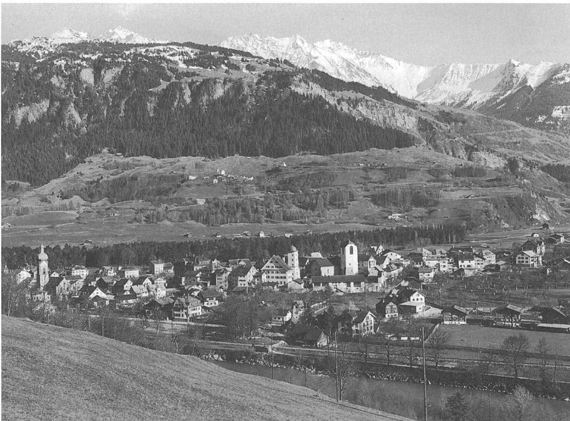
Glion viers Sevgein, Grep e Signina. Maletg de bialas siluettas. Casa Gronda, baselgia de s. Margreta, la tuor Brünegg, seniester la baselgia catolica.

flava lu era pli tard il marcau de Glion tochen il barschament caschunaus duront l'uiara denter il cont Ulrich Walter de Belmont ed il cont de Werdenberg 1352. A Sogn Martin fuva gie era la sedia dil capo-administratur dil ministeri a Tuverasca de pli baul. La villa , quei fuss la cuort segnerila digl uestg Tello, ed entginas cuorts purilas (culegnas) eran plinengiu ella vischionza della caplutta de s. Margreta de pli tard. La famiglia della gliend regala seconstitueva dad emploiai, da vasals, da purs libers e nunlibers. Ella formescha il fundament della populaziun de Glion-sura de pli tard. Il svilup ulteriur de Glion ei buca enconuschents e pusseivels d'eruir, demai ch'ils documents dil 10 al 13avel tschentaner mauncan dil tuttafatg. Mo para ei che negins signurs hagian pudiu fitgar pei sco possessurs de cuorts e beins a Glion-sura; ils libers purs paran d'aver dominau en diember.