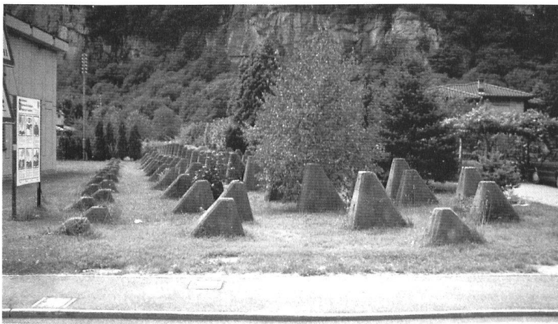
«Dents de dragon» à Lodrino.

Dans la conception du Réduit, les troupes frontière continuent à occuper leurs positions; par conséquent, le dispositif de la brigade frontière 9, récemment constituée, n'aurait pas dû changer de façon essentielle. Pourtant, l'emploi de parachutistes durant la campagne de France pousse le commandant du 3 e corps d'armée à combler le vide au nord de Bellinzona, en particulier dans le secteur entre Biasca et Claro. Il constitue un groupe de combat chargé de barrer l'axe Bellinzona - Biasca à la hauteur de la ligne de Lodrino - Osogna 14 et