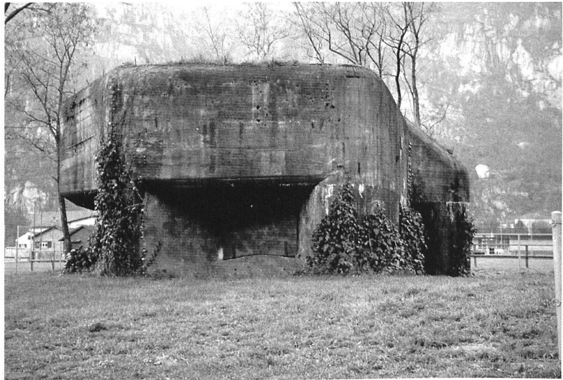
Fortin d'infanterie.

Contrairement aux attentes des habitants de Lodrino, la ligne n'est pas démantelée après le service actif, et les terrains ne sont pas rendus aux anciens propriétaires. La «LONA» devient partie intégrante du paysage «lodrinense». Entre 1950 et 1960, une deuxième ligne est édifiée dans la zone de Iragna, à l'endroit où, pendant la guerre, avait été préparée une défense mobile pour arrêter d'éventuels chars ennemis qui auraient réussi à passer le barrage principal. Ultérieurement, la