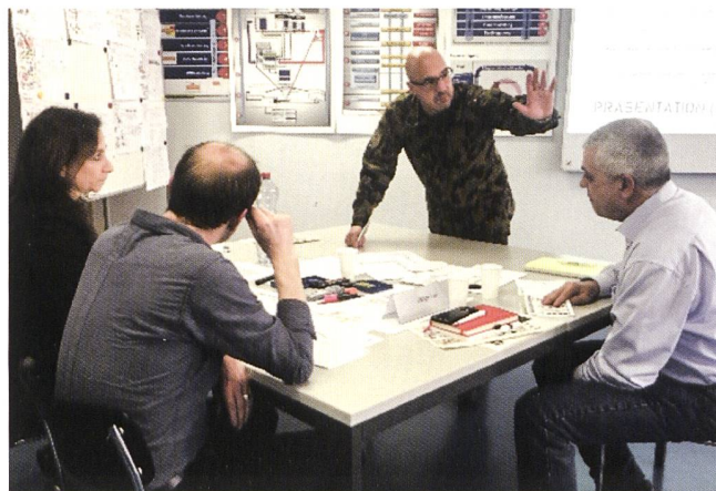
Da sinistra: Corso "Gestione dei conflitti" con ufficiale professionista come insegnante e coach. Corso "Gestione dei conflitti" con ufficiale professionista come insegnante e coach.

anche dimostrare nel modo più concreto e pratico possibile come viene gestito l'Esercito svizzero. Dopo aver completato un corso TRANSFER, i partecipanti saranno in grado di applicare ciò che hanno imparato e sperimentato nella vita quotidiana. In particolare, i capi e i responsabili delle risorse umane devono comprendere il valore aggiunto dell'istruzione alla condotta militare, riconoscerlo come un'ulteriore caratteristica qualitativa dei futuri candidati e sostenere o addirittura motivare i propri dipendenti a proseguire l'addestramento militare.