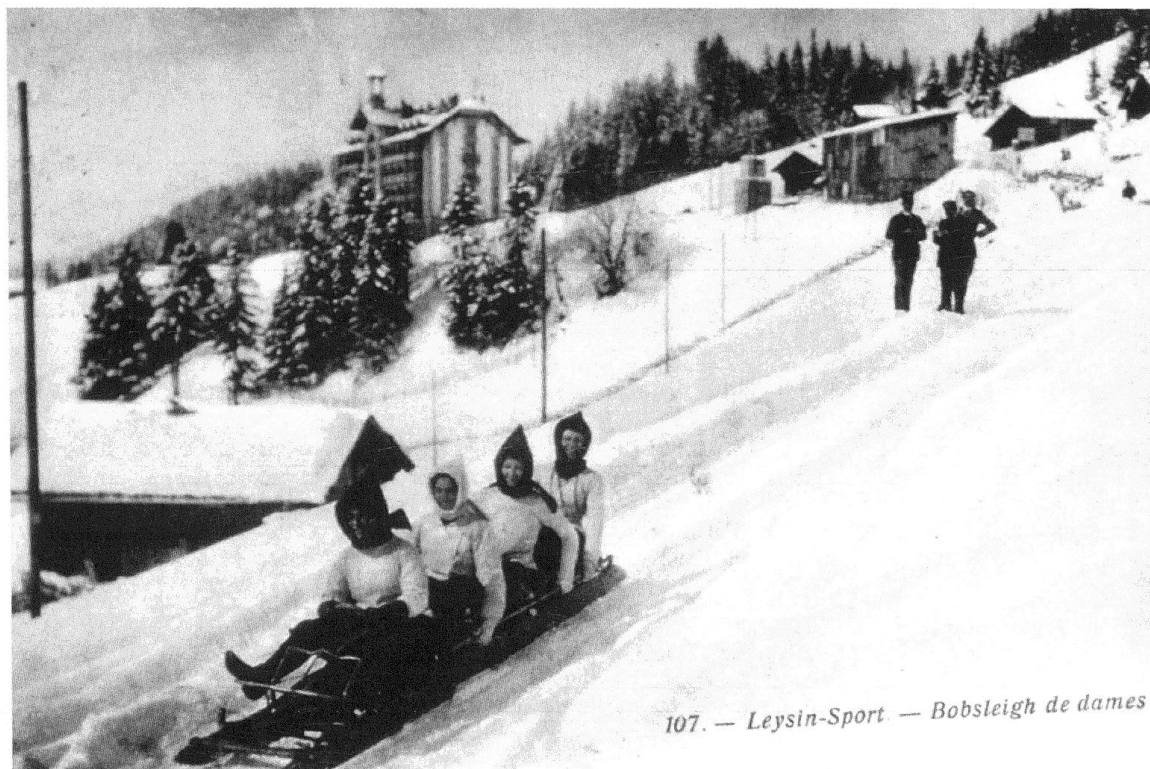
2 Leysin Sport – Bobsleigh de dames, carte postale, coll. Gilbert Bollea.

diverses associations relayeront les efforts des promoteurs professionnels. À Adelboden est fondé en 1903 un ski-club censé donner conseil et appui aux adeptes du ski; plusieurs guides officient comme instructeurs 11 . À Leysin, une association appelée Sporting-club, créée en 1903, anime la localité en mettant sur pied des activités variées allant des gymkhanas aux rencontres de bandy – une forme ancienne de hockey sur glace – en passant par des bals masqués sur glace et des courses de ski 12 . En mars 1903 a lieu une course de luges et de bobsleighs, qui réunit quelques 300 spectateurs 13 . Mais le Sporting-club porte aussi au loin le nom de la localité en se rendant plusieurs années consécutives à Lyon pour y disputer des rencontres de hockey sur glace 14 . Les bobeurs et les hockeyeurs de diverses stations se lancent des défis et les succès sont vus comme autant de points marqués en faveur de la gagnante: «Les