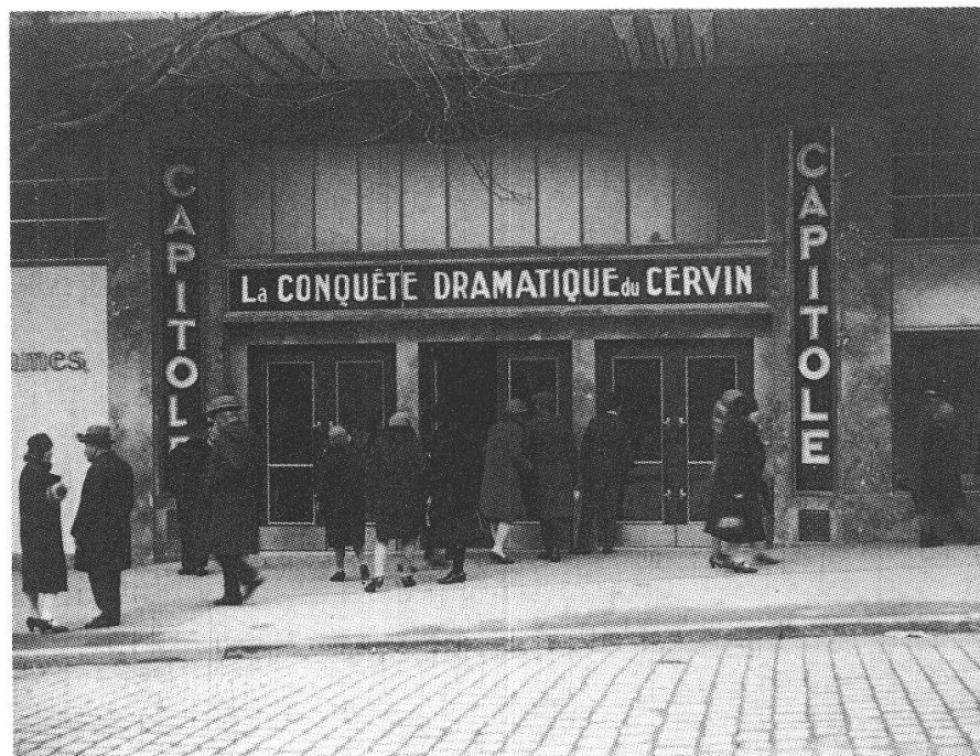
1. et 2. Photogrammes tirés de La Construction du plus beau cinéma de Lausanne le « Capitol », Office cinématographique Lausanne, 1928, CSL 79 B 15.