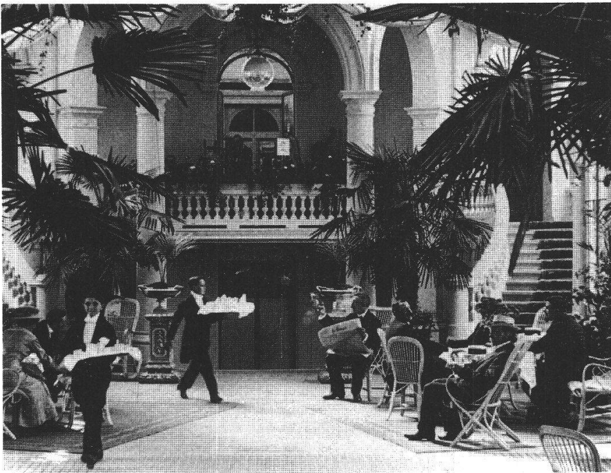
3. Photogramme tiré de Chemin de fer des Rochers de Naye (Suisse), années 20, CSL 84 B 1617.