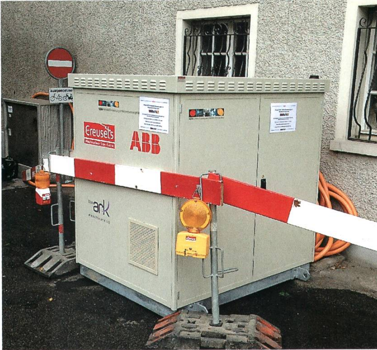
Der mobile Frequenzumformer im Einsatz bei der Verteilkabine VK Johannitergasse in der Altstadt

Im Testnetz von VEiN wurden weitere technische Anlagen zur Beherrschung der vermehrten dezentralen Einspeisungen eingesetzt. Dies ist zum einen ein regulierender Transformator in der TS Kreuzmatt, der abhängig von der Last der Verbraucher und der Stromeinspeisung ab den PV-Anlagen oder den Blockheizkraftwerken die Spannung regelt, so dass die Spannungsnorm eingehalten wird und die Endverbraucher nichts von der neuen Situation mit vermehrter dezentraler Einspeisung feststellen. Dieselbe Funktion erfüllt ein Längsregler, jedoch nicht für das gesamte Niederspannungsnetz, sondern lokal, an dem Ort, wo er platziert wird. In VEiN war im Sommer 2016 ein Längsregler bei der VK Roberstenstrasse im Einsatz, um die Spannungsschwankungen auszuregulieren, die von den beiden grossen PV-Anlagen beim Mehrfamilienhaus Zähringer und beim Parkhaus Kurzentrum verursacht wurden.