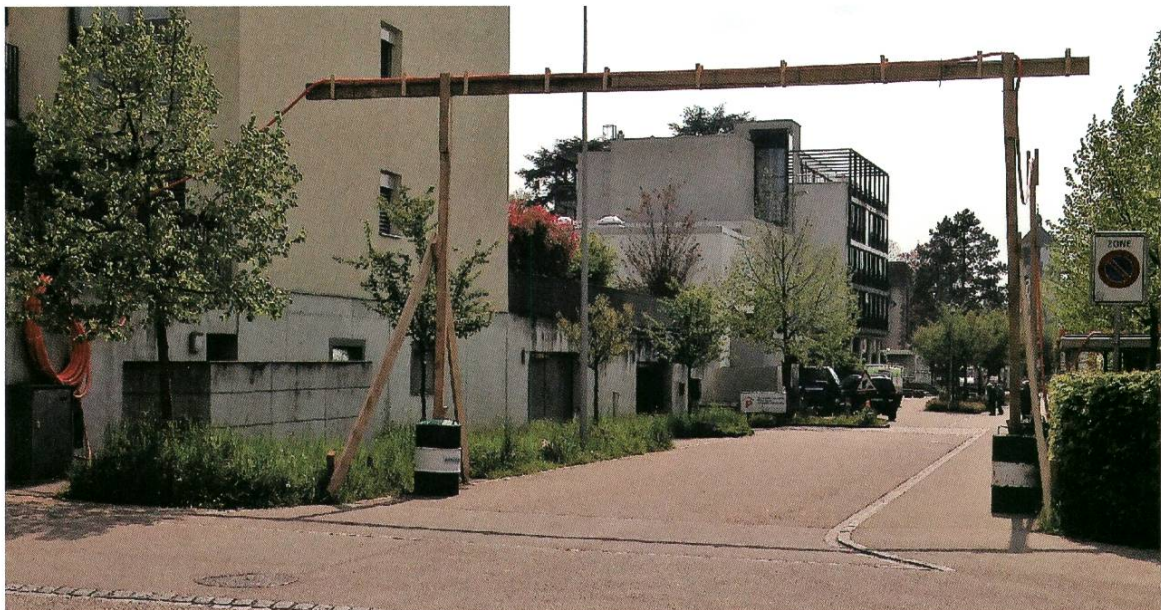
Kabelüberführung bei der VK Parkweg während dem Test mit der Vermaschung

Zusätzlich zu den Anlagen werden auch die Erkenntnisse aus VEiN weiter genutzt werden können. So konnten mit VEiN einige theoretische Aussagen zur dezentralen Stromeinspeisung bestätigt und gefestigt werden, dank denen die Verteilnetzbetreiber nun die Gewiss-