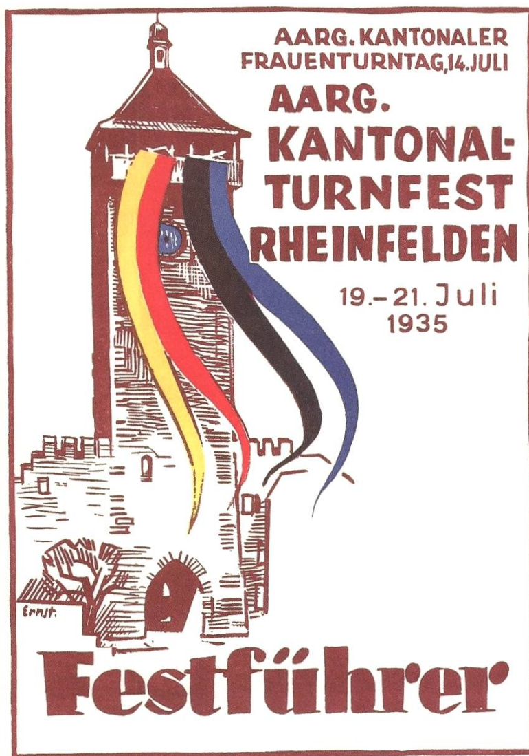
Festführer Aargauer Kantonalturfest 1935 in Rheinfelden