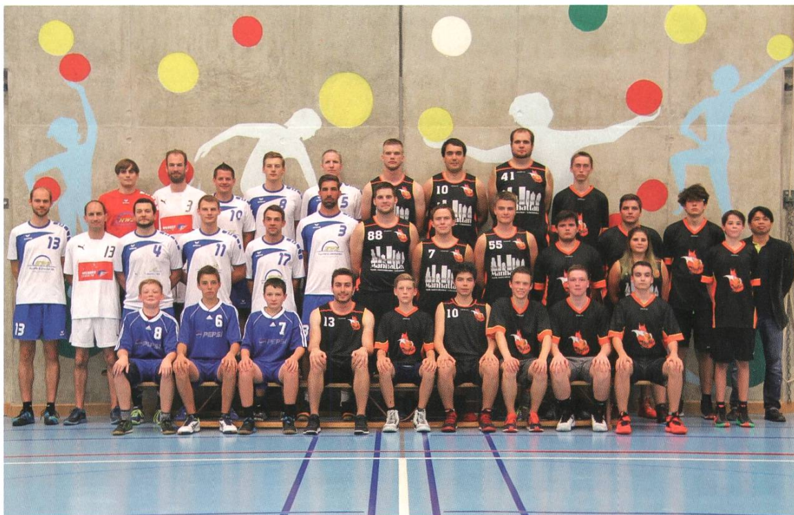
Der TSV Rheinfelden in seinem 150. Vereinsjahr In schwarz/orangen Dresses: Basketballriege, in blau/weissen Dresses: Handballriege

Wenn man sich in der Bevölkerung umhört, ist der TSVR nicht sehr präsent. Vorbei sind die Jahre als die Turner zusammen mit dem Fussball- und dem Eishockeyclub die Sportszene, mit den HOTUFU – Bällen aber auch die Fasnacht prägten. Der TSVR beteiligt sich im Jubiläumsjahr mit einer Aktiv-, einer Senioren- und einer Juniorenmannschaft