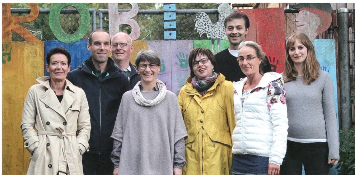
Der Vorstand des schjkk

Bald konnte uns die Stadtverwaltung geeignete Büroräumlichkeiten zur Verfügung stellen. Die Buchhaltung und die Personaladministration, die bisher durch die Stadtverwaltung erledigt wurde, wurden an die Geschäftsstelle übertragen. Der schjkk war jetzt auch in der Lage, junge Menschen im sozialpädagogischen Bereich auszubilden und für Nachwuchs in dieser wichtigen Arbeit zu sorgen. Ich selber habe mich dann beruflich neu orientiert und bin vor 7 Jahren weitergezogen, bin aber mit Überzeugung im Vorstand des Verein schjkk geblieben und arbeite noch immer sehr gerne mit. Unsere Aufgabe besteht weiterhin darin, die Finanzierung des Vereins sicherzustellen und den Verein nach aussen zu vertreten. Dazu treffen wir uns zu 5 Sitzungen im Jahr. An diesen Sitzungen nehmen auch Mitarbeitende der Betriebe teil. Sie berichten uns über die vergangenen und bevorstehenden Projekte und Ereignisse in Ihren Betrieben. Die Vorstandsmitglieder helfen je nach Möglichkeit immer gerne bei den verschiedenen Anlässen mit. So behalten wir den Kontakt zu den Mitarbeitenden und bekommen immer wieder Einblick in die Arbeit mit den Kindern und Jugendlichen. So durfte ich während 15 Jahren die positive Entwicklung der Kinder- und Jugendarbeit in Rheinfeldern miterleben und stehe dem Verein schjkk seit dem Frühjahr 2015 als Präsidentin vor.