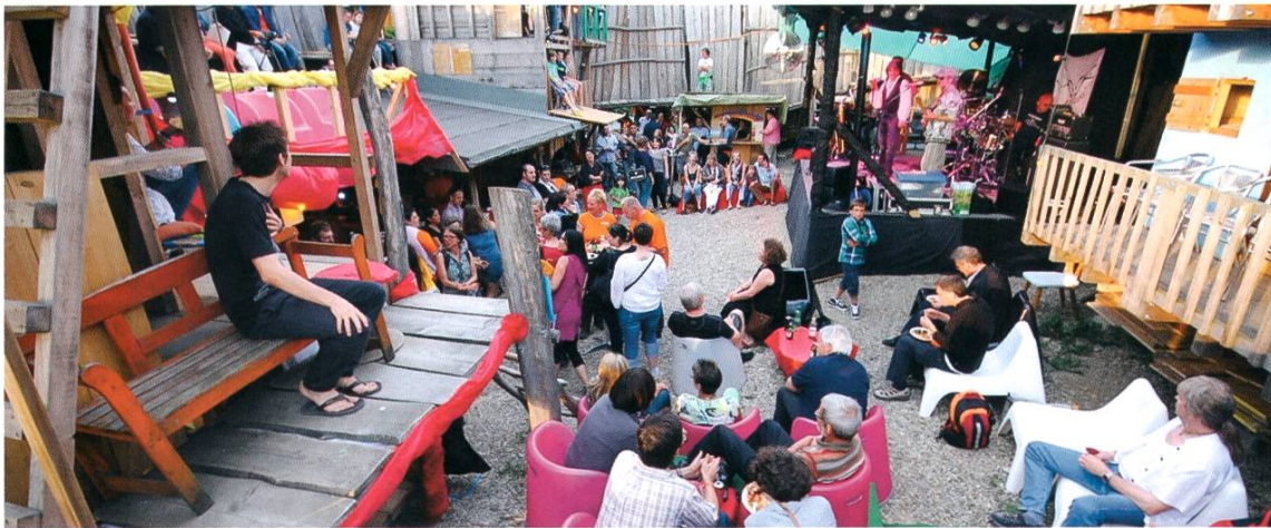
Mit einem Benefizanlass 2013 wurde der Wiederaufbau gefeiert.