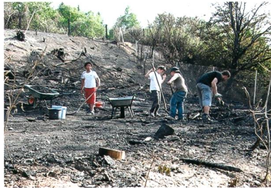
Der Brand zerstörte die Hüttenstadt auf dem Robispielplatz vollständig.