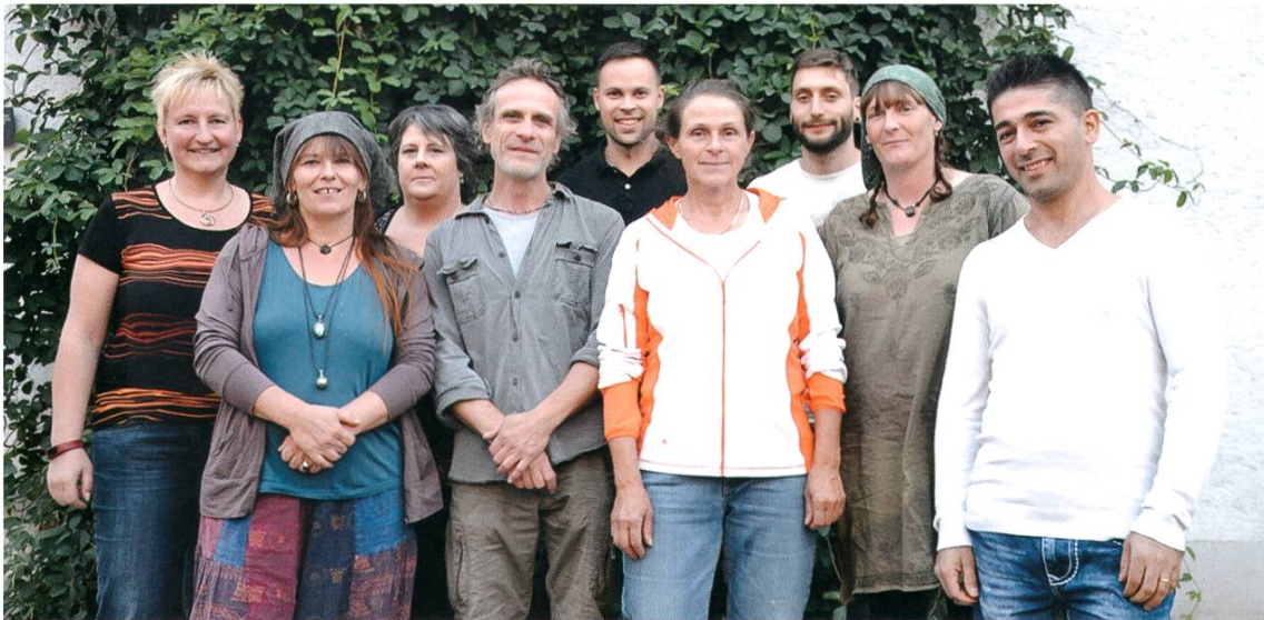
Die Mitarbeitenden des schjkk ,

Der Verein schjkk ist in der glücklichen Lage mit gut ausgebildeten und sehr erfahrenen Fachkräften zusammenarbeiten zu können. Teilweise sind die Mitarbeitenden dem schjkk und den Kindern und Jugendlichen seit Jahrzehnten treu geblieben. Von ihrer starken Identifikation mit ihrer Arbeit, sowohl im pädagogischen Bereich wie auch im aufwändigen Unterhalt der Betriebe, profitieren alle Beteiligten. Diese Anforderung steht in keinem Pflichtenheft. Der Vorstand des Vereins schjkk versteht dieses Engagement seiner Mitarbeitenden als grosses Kompliment für ihn als Arbeitgeber.