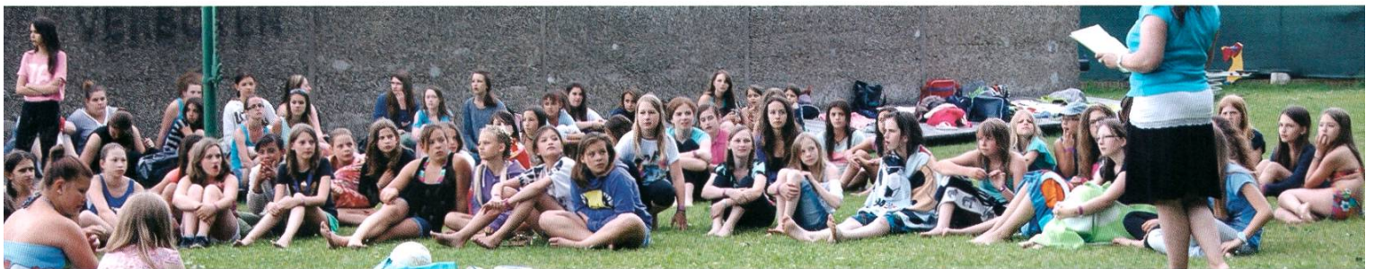
Girls Pool Night

Das riesige Engagement für den jungen Verein, den damals noch zahlreichen Vorstandsmitglieder, die verschiedene Institutionen und Vereine zum Thema Kinder und Jugend vertraten, hat mich zutiefst beeindruckt. Es herrschte Pioniergeist und eine grosse Begeisterung für