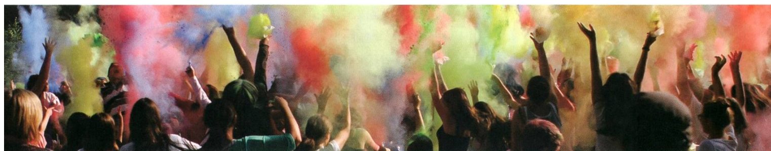
Holispektakel Jugendfest Rheinfelden