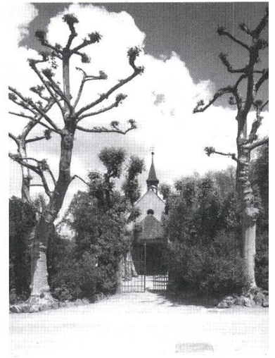
Friedhof mit Gottesackerkapelle vor der Umgestaltung in den 70er Jahren.

Anfang des 20. Jahrhunderts umgibt somit eine weitläufige Parklandschaft das Kurbad. Dietschy erhält die Grundstruktur des Parks der Villa Franke und verknüpft ihn mit dem Kurpark. Geschwungene feinverästelte Spazierwege und breitere direkte Fahrstrassen führen durch Baumhaine, offene Grünflächen und entlang von Baumreihen vorbei an zahlreichen Möglichkeiten zur Zerstreung und körperlichen Ertüchtigung: «Die Freunde des Lawn-Tennis, Kegel- und Croquetspiels finden vorzügliche Spielplätze. Für die frohe Kinderschar sind besondere zweckmässige Spielplätze reserviert. Ein kleiner Eselwagen steht ihnen täglich zur Verfügung, und in einem Gehege werden gezähmte Hirsche gehalten, denen sie traulich das Futter reichen dürfen...». Im Park verstreute Nebengebäude erweitern das Angebot des Hotels. Zu diesen heute nicht mehr vorhandenen Bauten gehören die «Villa Friedau», als «Gartenhaus» bezeichnet, die Dependence «Villa Flora» und eine «Remise» vis-à-vis der Dependence sowie ein Musikpavillon. Die Erweiterung des Hotels 1911/12 zeugt vom grossen Erfolg. Ein anderes wichtiges Bauvorhaben, das Rheinquai, wird 1912 fertig gestellt. Es ist ein weiterer Baustein im Plan Dietschys für eine grosszügige Parkanlage, die für die Kurgäste aus aller Welt einen bleibenden Eindruck hinterlassen soll. Die Ansprüche jener Zeit verlangen eine «in sich abgeschlossene Welt, die den Gast empfängt,