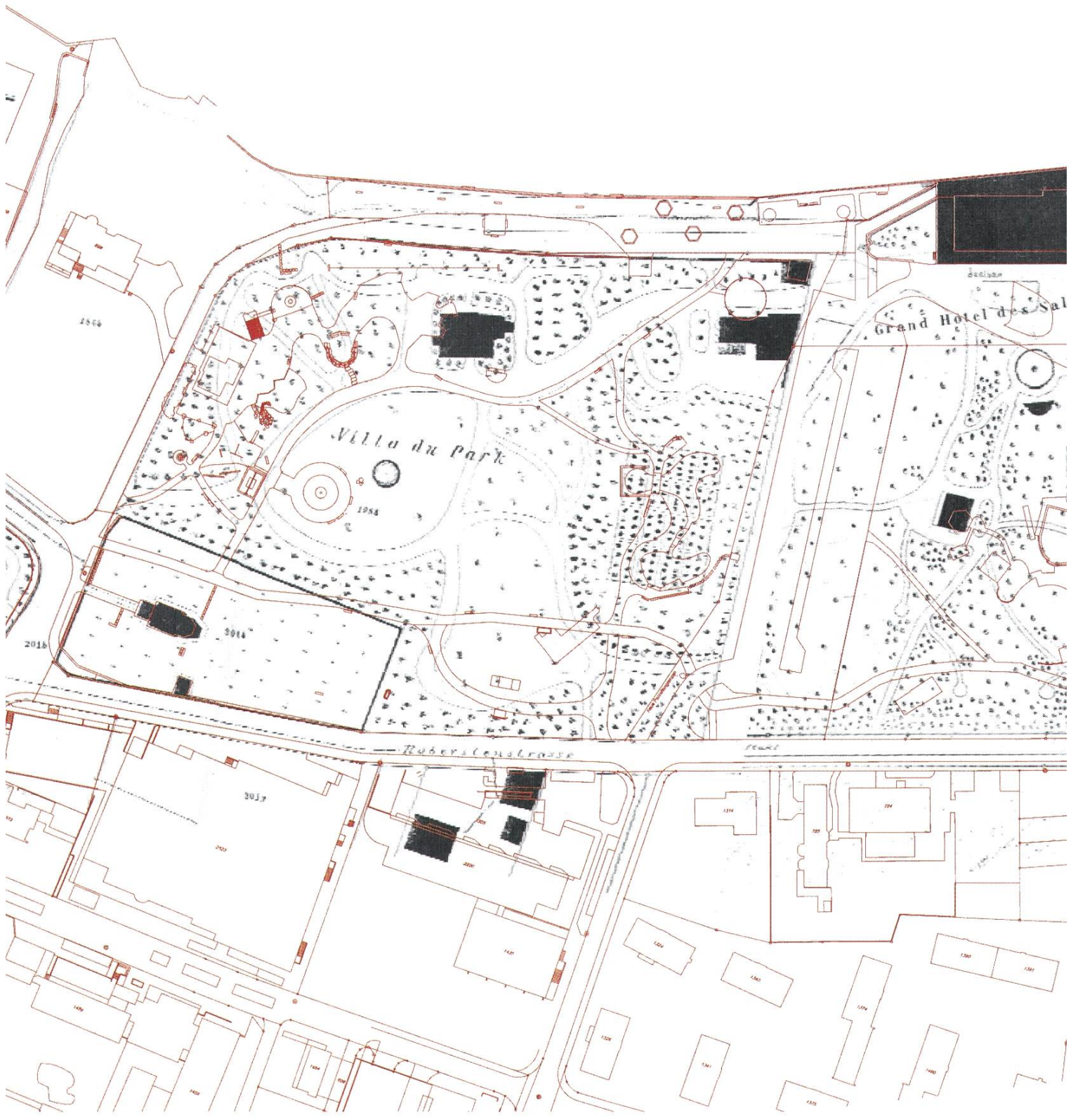
Der Kur- und Stadtpark 1897/1904 (schwarz) mit dem überlagerten heutigen Bestand (rot)