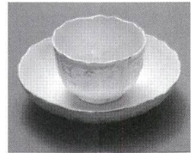
Koppchen und Unterschale, altes Trinkgeschirr zum Genuss von Kaffee.

Die Schokolade generierte wegen ihrer Zubereitung das aufwendigste Porzellan. Da Schokolade sehr heiss und schaumig getrunken wurde, waren neben den speziellen Tassen auch spezielle Kannen nötig. Sie hatten mehrheitlich einen seitlichen Henkel und Füsschen, um sie auf eine Warmhalteflamme stellen zu können, im Deckel befand sich oftmals ein mit einem Schieber verschliessbares Loch für den Quirl.