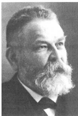
Emil J.R. Frey (1838-1922)

Der Sonderbund der katholischen Kantone der Schweiz, der im Sonderbundskrieg von 1847 unterlag, hatte Parallelen zum späteren amerikanischen Bund der Konföderierten (Südstaaten) und dessen Besiegung im Sezessionskrieg. Der schweizerische Bundesstaat von 1848 kopierte das US-Modell von 1787, an erster Stelle das Zweikammersystem: den Ständerat entsprechend dem US-Senat, den Nationalrat entsprechend dem US-Repräsentantenhaus. Einer, der am intensivsten die Übernahme der US-Verfassung durch die Schweiz propagierte, war Ignaz Paul Vital Troxler (1780-1866). Troxler, in Beromünster LU geboren, studierte ab 1800 in Jena und Wien Philosophie, Naturwissenschaft und Medizin. Er wirkte als Philosophieprofessor in verschiedenen Städten Deutschlands und der Schweiz, wo er zäh gegen Aristokratentum und Reaktion kämpfte. Er wurde 1831 Rektor der Universität Basel, musste aber die Stadt fluchtartig verlassen, weil er für Baselland Partei ergriffen hatte. In Aarau war er daraufhin als Mittelschullehrer und Arzt tätig und wurde 1832 Grossrat, 1834 Professor der Philosophie an der Universität Bern. Er war ein hervorragender Vordenker der Anthroposophie von Rudolf Steiner. Er starb in Aarau. 28