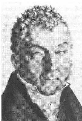
Ignaz Paul Vital Troxler (1780-1866)

ne hegten, die Universität Genf («L'Académie de Calvin») zu kaufen und in die USA zu transferieren! Initiant dieser Pläne war ein Genfer Revolutionär hugenottischer Abstammung, François d'Ivernois (1757-1842). 27 Eine symbolhafte, wenn auch zufällige Gemeinsamkeit lag darin, dass im 18. Jahrhundert die Eidgenossenschaft aus 13 «Orten» bestand, die Vereinigten Staaten aus 13 «Kolonien» (ehemals britische Kolonien), die es zu vereinigen galt.