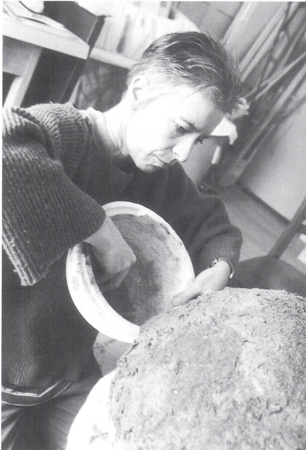
Atelier, Arbeit an einer Erdschale

Mit dem Schaffen der englischen und amerikanischen Land-Art-Künstler hat meine Arbeit sicher Berührungspunkte. Ich bewun-