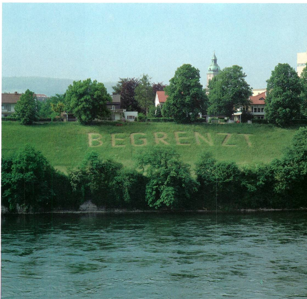
Das Rheinbord am deutschen Ufer als Transparent