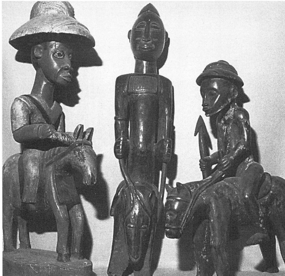
Pferde in der afrikanischen Kunst