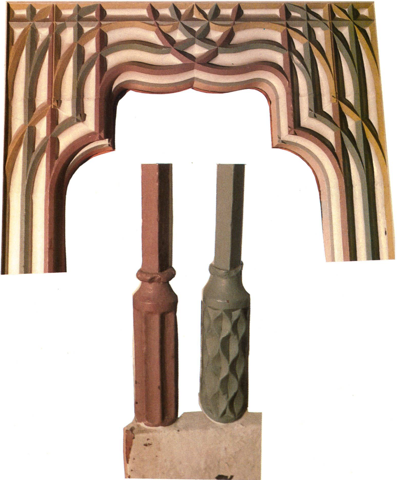
Portal im zweiten Stock. Die Türe und Beschläge sind von Gewerbeschülern nach 1953 gemacht worden.