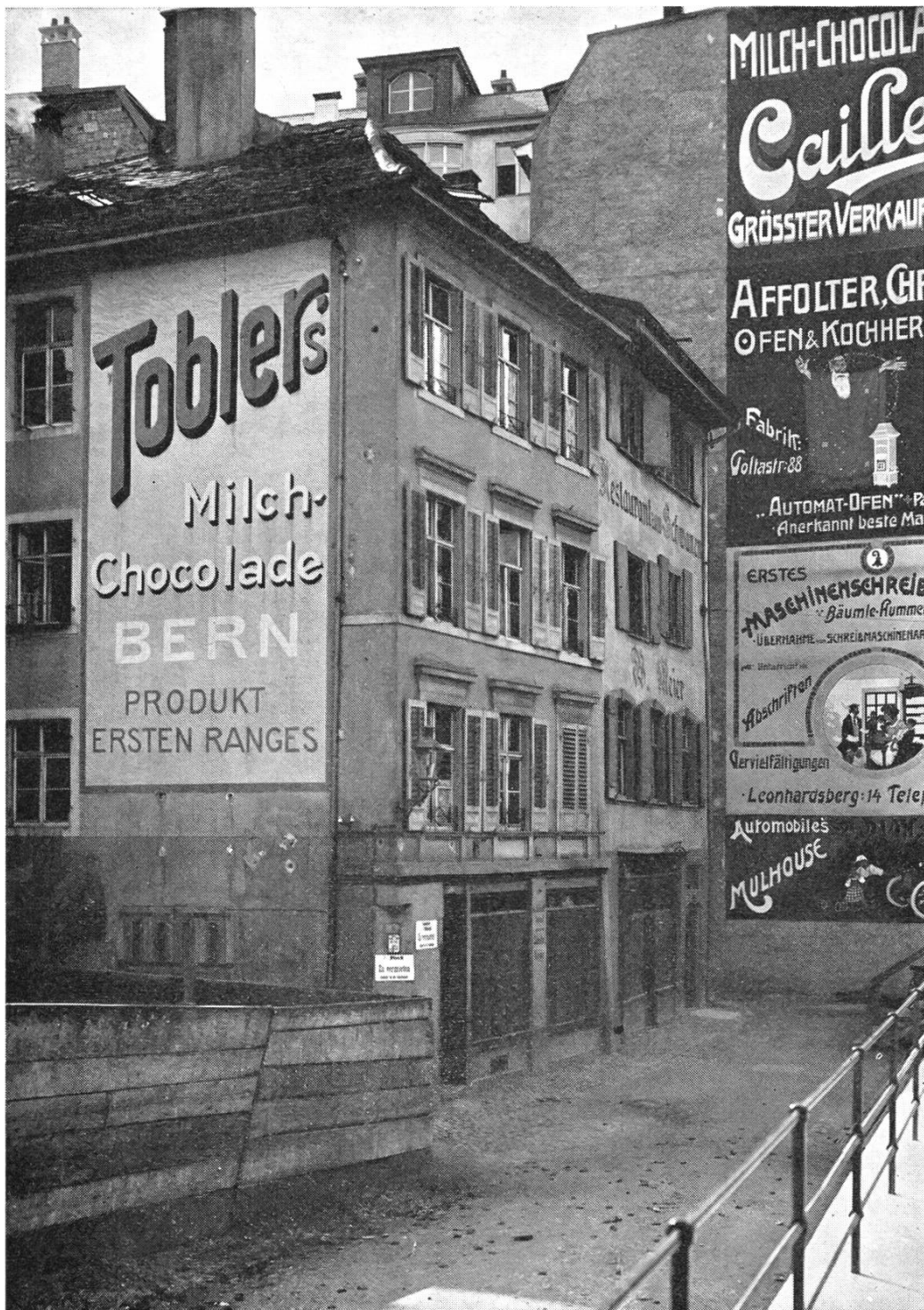
Bis 1830 wirtete Frau L'Orsa (damals Therese Steinmann-Baumer) auf dem «Schwanen» in Basel. Mit 25 Jahren das erstmal verwitwet, heiratete sie Theophil L'Orsa. Der «Schwanen» (zweites Haus von links) stand an der nicht mehr existierenden Schwanengasse beim Blumenrain.