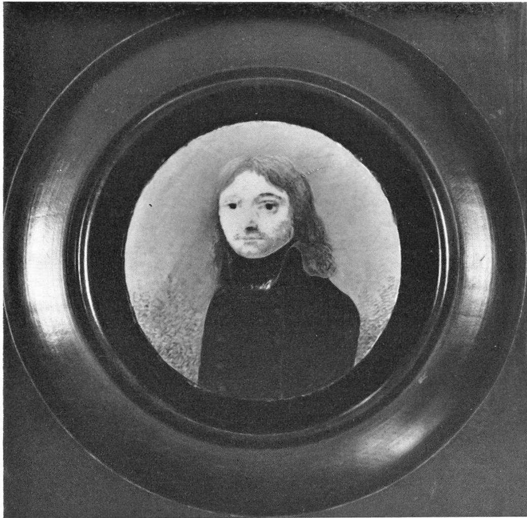
Theophil L'Orsa ca. 1847. Nach einem Porträt im Besitze von Frau B. Bölsterli-Ambühl, Ennetbaden.

liebe Therese» seine Liebe und sein Bestreben, sich ihr würdig zu zeigen. Am 6. Februar 1853 ist Theophil gestorben!!