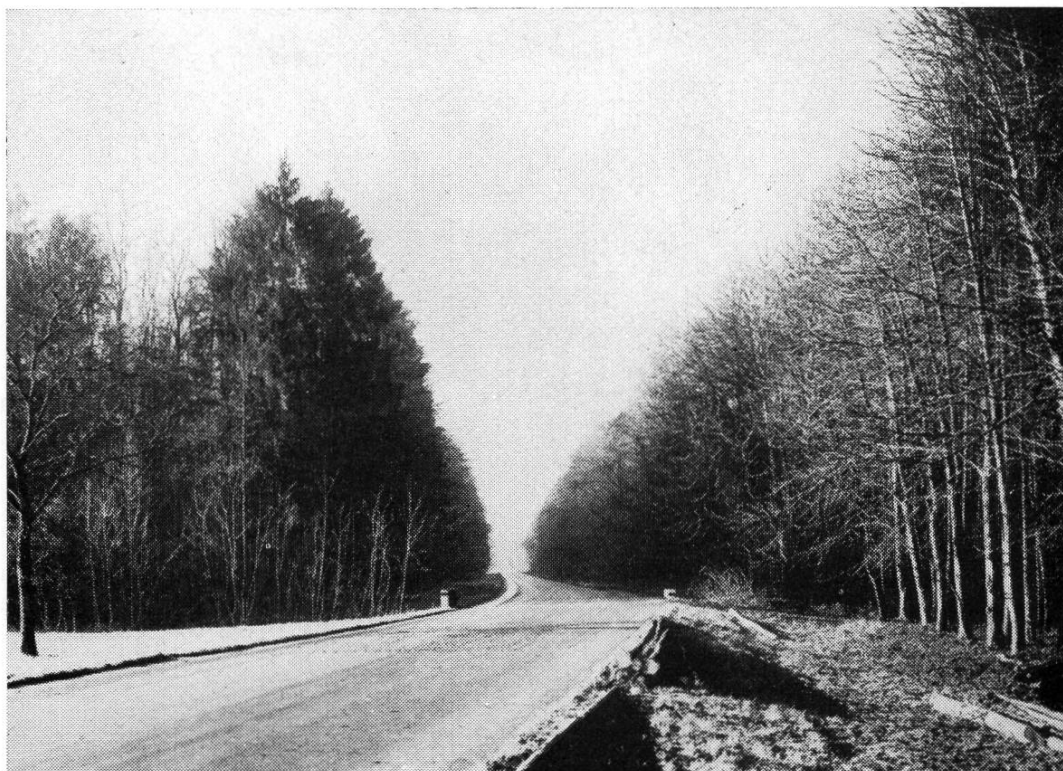
Abb. 2. Am Augsterstich