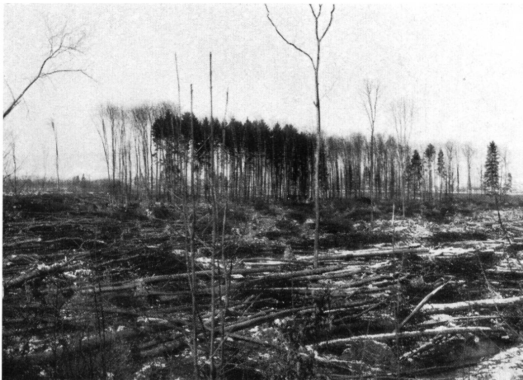
Abb. 3. Während der Rodung