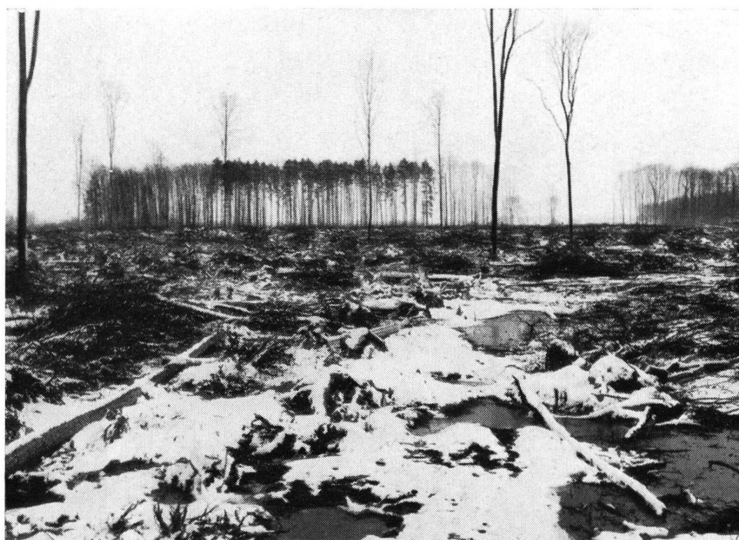
Abb. 4. Während der Rodung