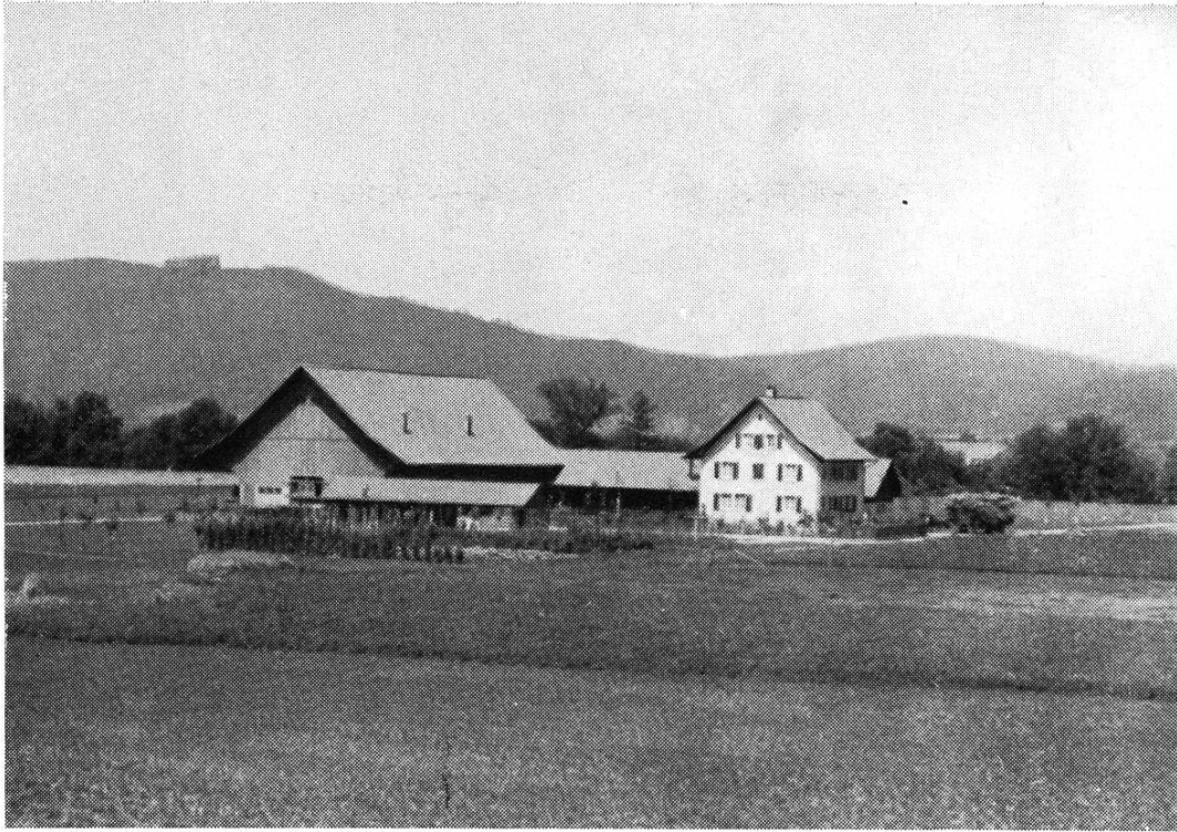
Abb. 5. Der Waldhof

Kosten sicherten Bund und Kanton einen Beitrag von total 40 Prozent zu. 1945 fasste die Bürgergemeinde den entsprechenden Beschluss. Erst 1947 wurde mit dem Bau begonnen, 1948 wurde er fertig erstellt (Abb. 5). Die Gesamtkosten beliefen sich auf Fr. 357 000.—. Daran hatte die Bürgergemeinde Fr. 258 000.— zu leisten. — Der vom einstigen Wald anfallende Holzerlös betrug Fr. 203 000.—, so dass der Bau des Hofes sozusagen von den Mitteln des Waldes getragen wurde. Aus diesem Grunde und zur Erinnerung wurde ihm auch der Name «Waldhof» verliehen.