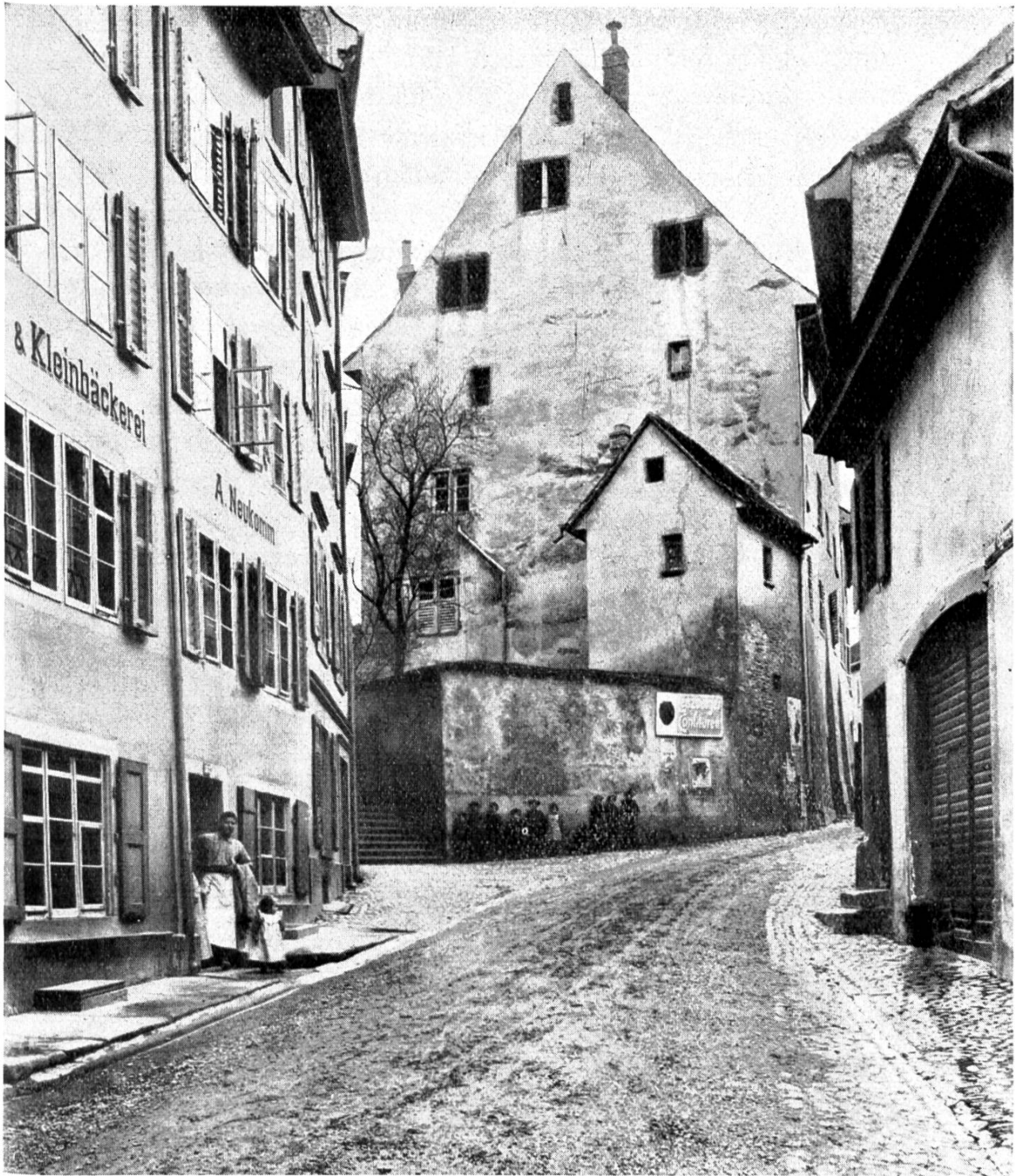
Abb. 2 Beuggenhaus von unten