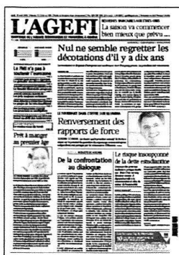
Lu - Ve Kiosque / Abonnement

Retrouvez l'intégralité de nos contenus sur www.agefi.com