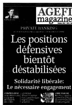
6 parutions Kiosque / Abonnement