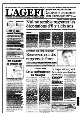
Lu - Ve Kiosque / Abonnement

Retrouvez l'intégralité de nos contenus sur www.agefi.com