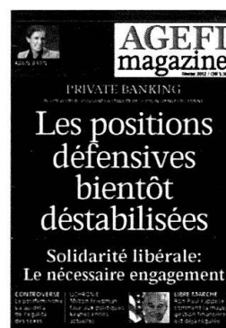
6 parutions Kiosque / Abonnement