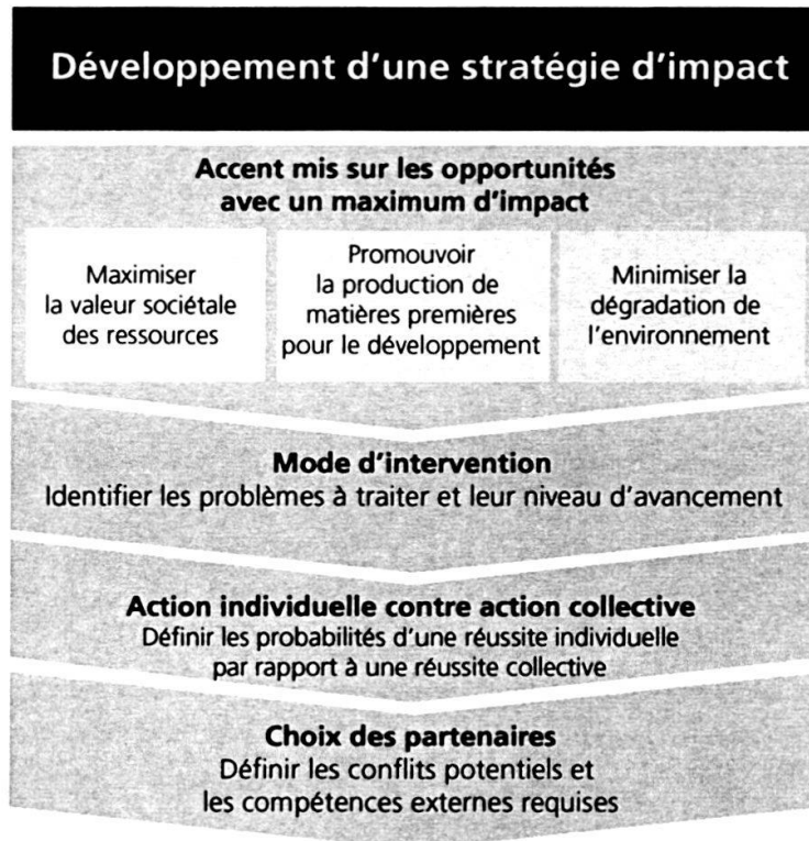
Schéma n° 3: Cadre d'action