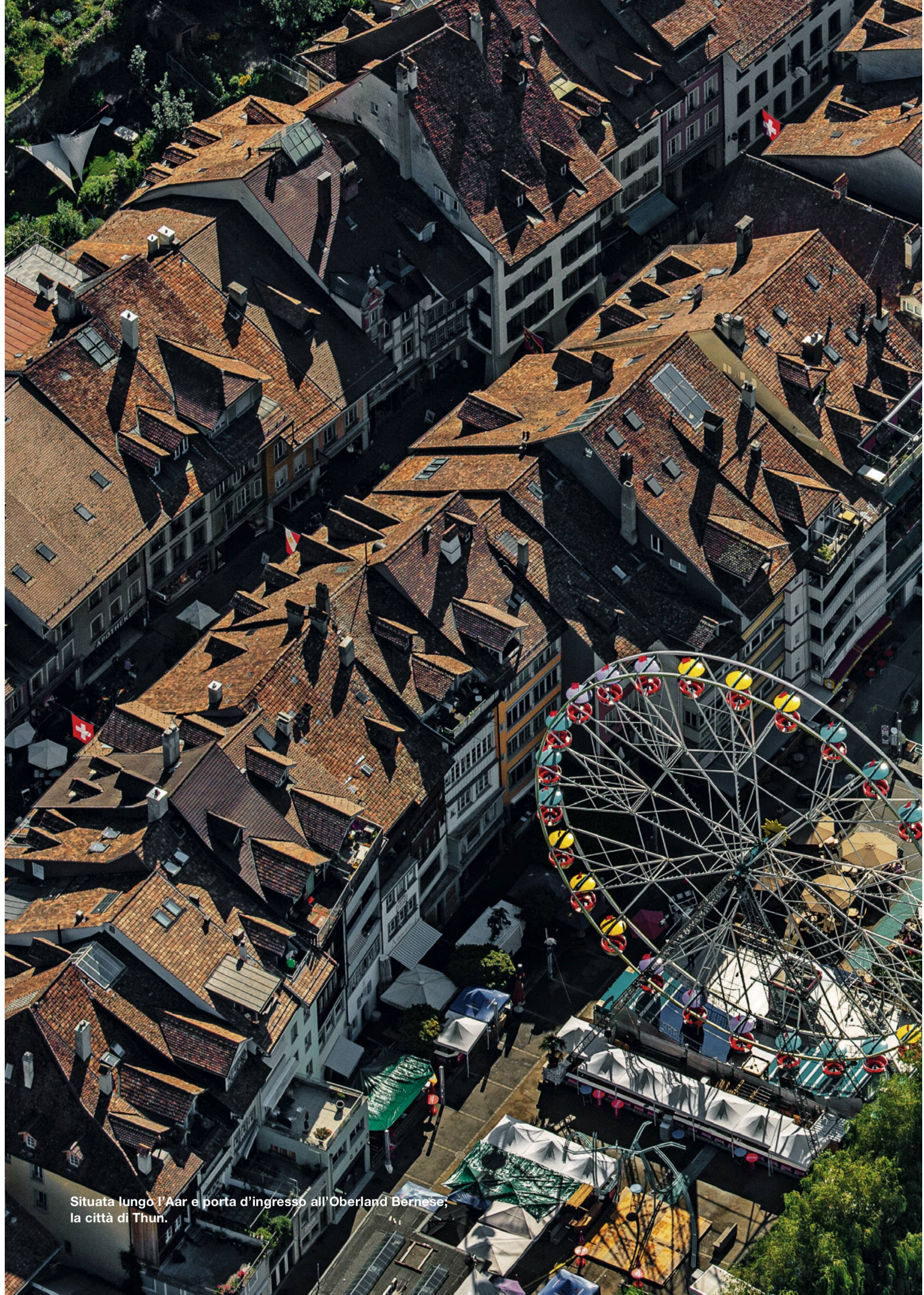
Situata lungo l'Aar e porta d'ingresso all'Oberland Bernese, la città di Thun.