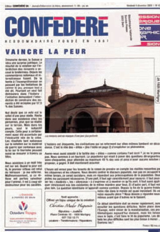
Uno dei quotidiani digitalizzati: Le Confédéré , prima pagina dell'edizione del 12.4.2009