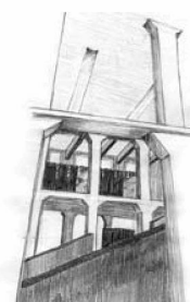
Biblioteca nazionale svizzera, veduta sui piani superiori; disegno: Saskia Buntschu