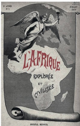
Una delle riviste digitalizzate: L'Afrique explorée et civilisée , prima pagina della prima edizione, luglio 1879

La mediazione culturale della BN ha avuto il suo momento forte con la serie di manifestazioni organizzate per celebrare i vent'anni dell'ASL 31 a Berna e con la mostra su Mario Botta 32 al Centre Dürrenmatt Neuchâtel (CDN). Nell'anno in rassegna 6312 persone (2010: 8341) hanno visto una mostra, assistito a una manifestazione o partecipato a una visita guidata presso la BN. Il calo dei visitatori è imputabile all'assenza di esposizioni di forte richiamo. Con 13 594 ingressi (2010: 12 164), nell'anno in rassegna il CDN ha invece registrato la maggiore affluenza di pubblico della sua storia.