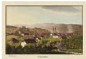
Hans Jakob Häkli: vue de Winterthur, vers 1820, gravure coloriée

Depuis 2016, les demandes des utilisateurs ne font que croître; plus de 1 000 requêtes ont ainsi été traitées, ce qui montre bien que l'indexation et la numérisation en cours donnent davantage de visibilité aux fonds. Les collections des Archives fédérales des monuments historiques (231 en 2020, 344 en 2019), de la photographie (319 en 2020, 388 en 2019), des arts graphiques (236 en 2020, 234 en 2019) ont été particulièrement demandées. Par contre, le nombre de visiteurs sur place a été moins élevé, du fait que la salle de lecture du Cabinet des estampes est restée fermée durant 21 semaines en raison de la pandémie. Les demandes pour des expositions ont beaucoup occupé le Cabinet des estampes, les curateurs ne pouvant choisir sur place les œuvres qu'ils auraient pu emprunter. Les préparatifs nécessités par les deux expositions de Nice et de Vienne à l'occasion du 90 e anniversaire de Daniel Spoerri en 2021 ont demandé davantage de travail que tout ce que le Cabinet des estampes avait fait jusqu'ici pour des prêts à des institutions externes.