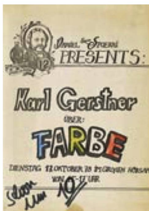
Daniel Spoerri presents: Karl Gerstner über Farbe, 1978, affiche