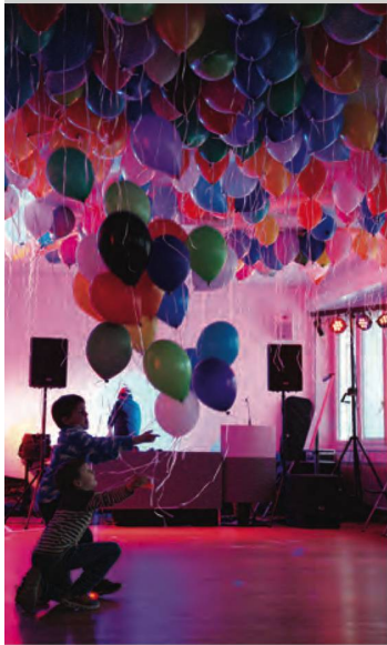
Lors de la Nuit des musées, les enfants ont pu lâcher des ballons