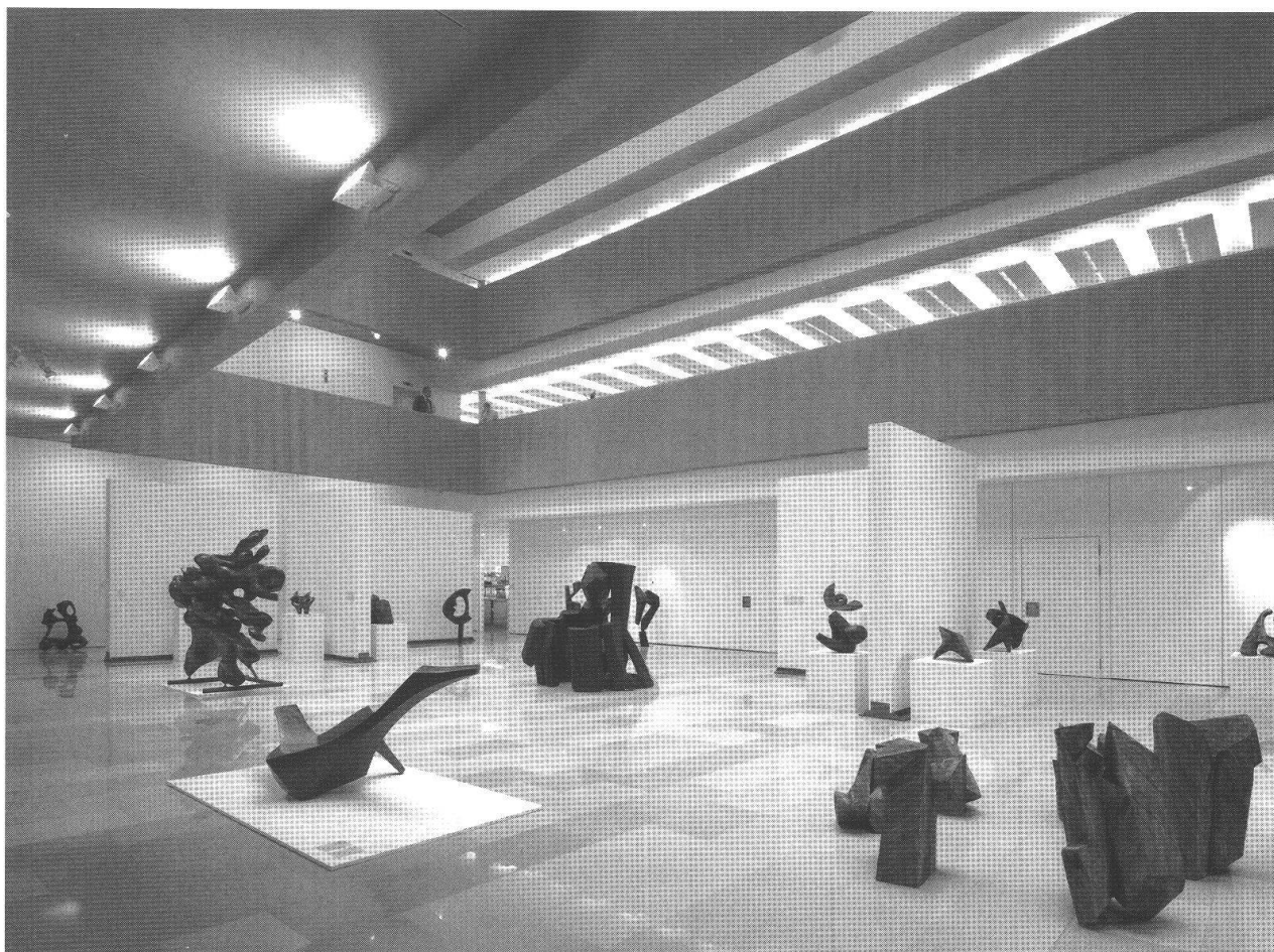
Veduta d'insieme della mostra nel Kulturforum Würth Chur a Coira, 2007