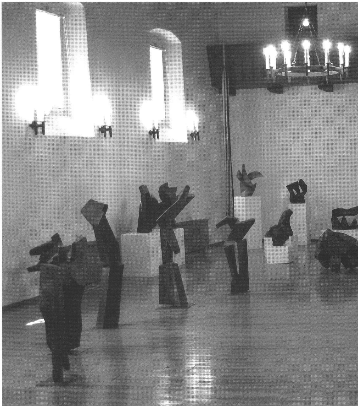
Veduta d'insieme della mostra nel Salone della Casa Comunale "La Tor" a Poschiavo, 2008

In margine a due mostre dedicate a Not Bott