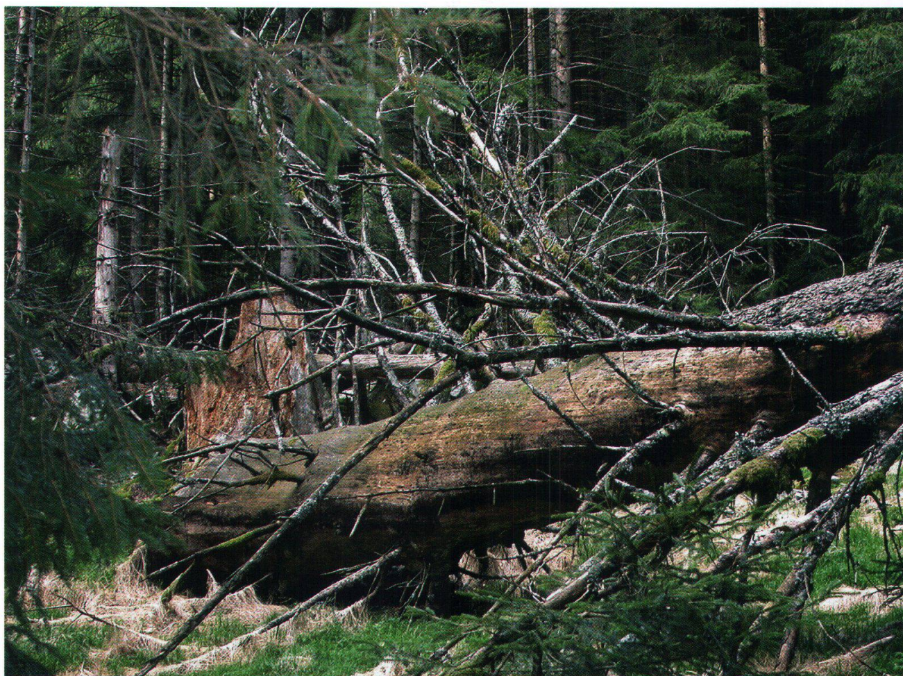
Val Cama, il legname morto è base di vita e riparo per numerosi funghi, invertebrati, uccelli e molti altri organismi

è l'unica attribuita alle due valli laterali. Non sussistono dunque conflitti con altre funzioni del bosco (la funzione di protezione dai pericoli naturali esclude, ad esempio, l'istituzione di una riserva forestale naturale);