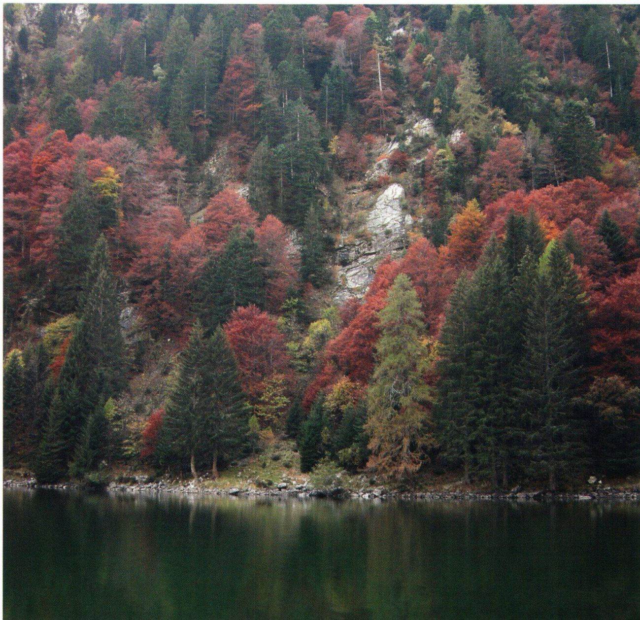
Una ripresa autunnale dell'abieteto-faggeta, l'associazione più rappresentativa in Val Cama, che sovrasta lo stupendo laghetto