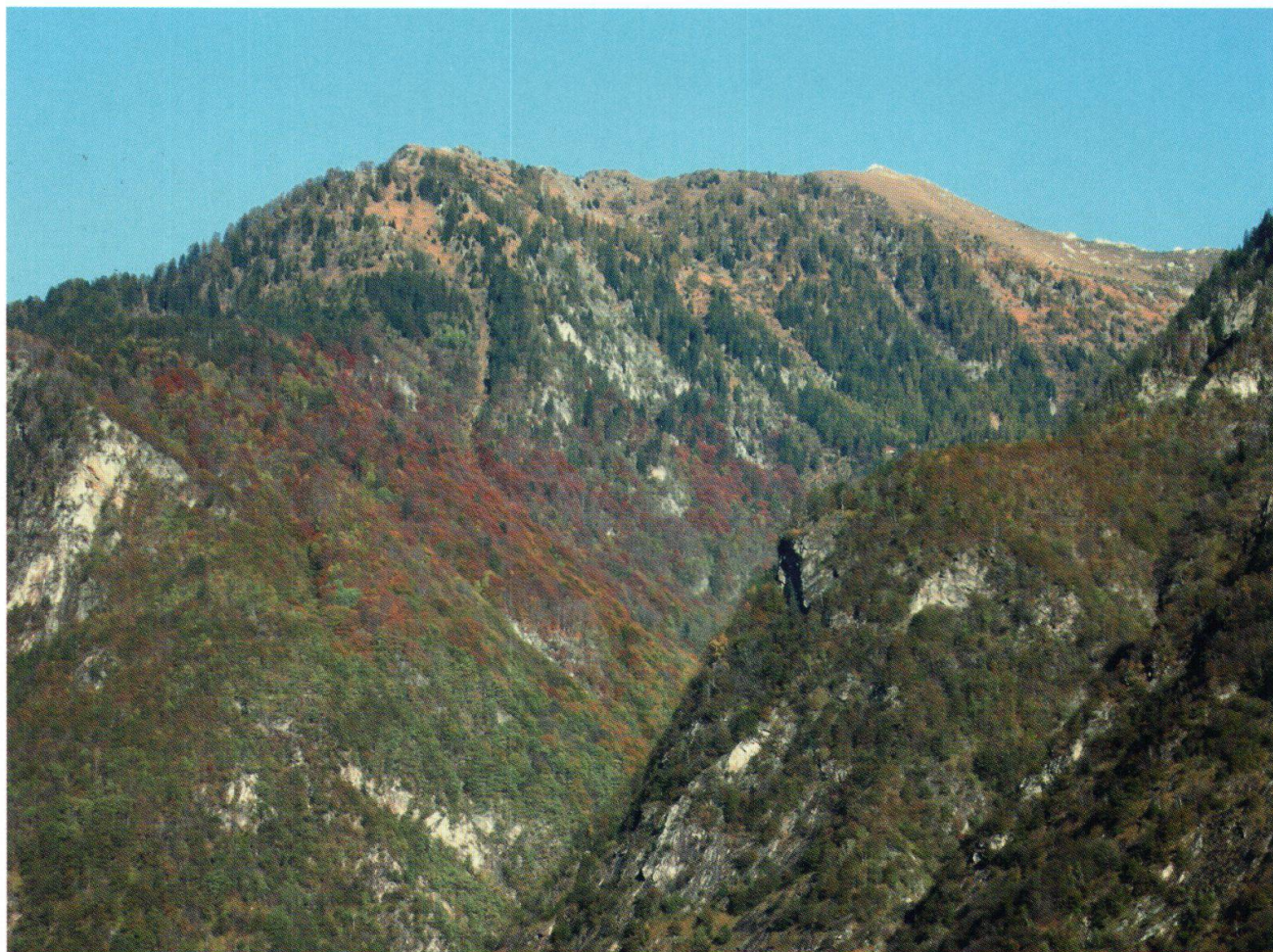
Val Leggia in autunno; risaltano le diverse associazioni forestali presenti ed in particolare in rosso la faggeta