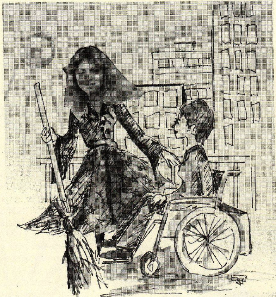
Zeichnung: Ursula Eggli

«Ich bin die hexe Pix und komme aus dem lande Pax. Bei uns leben nur frauen, und jetzt wollen wir alle frauen zu uns holen, die sich in ihrem lande nicht mehr glücklich