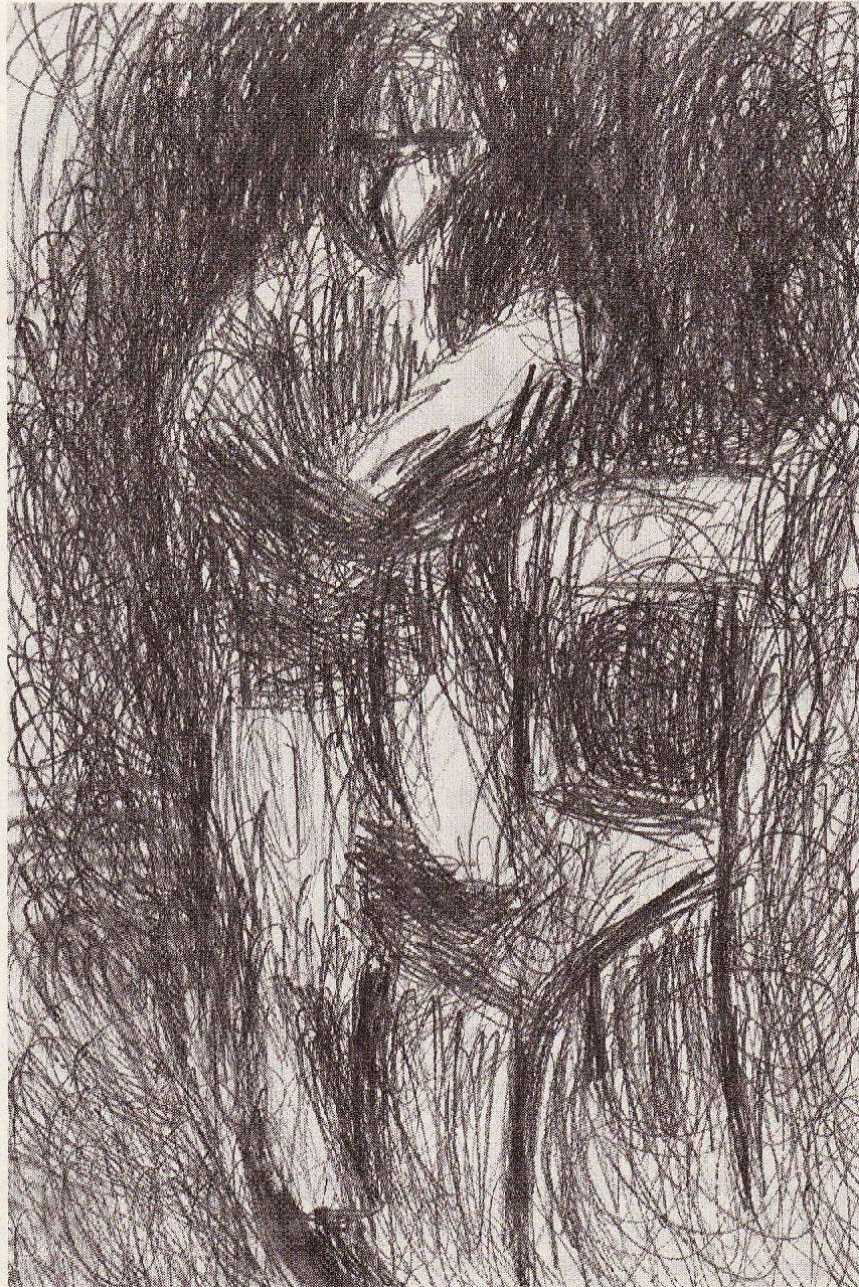
Vater mit kind

Verena Niklaus, c/o Dewald, 8802 Kilchberg Christoph Egli, Forchstr. 328, 8008 Zürich