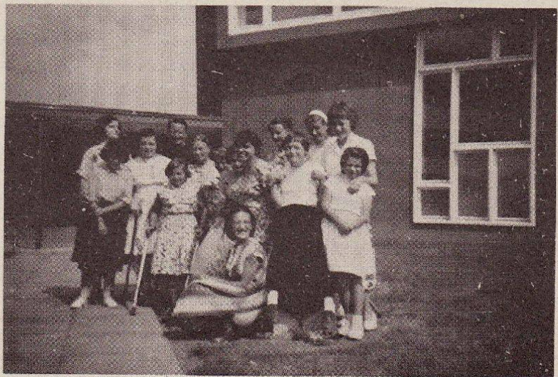
DAS ERSTE RIM-LAGER IN EINSIEDELN 1959

Der heutige hauptredaktor übernahm sein amt im frühjahr 1960. Der name des vereins lautete von anfang an "Ring invalider Mädchen" (RIM); daraus konnte man auch ablesen, dass es sich um eine gruppe behinderter mädchen handelte, die vom Blauring ausgegangen war und rechtlich immer noch zu ihm gehörte.