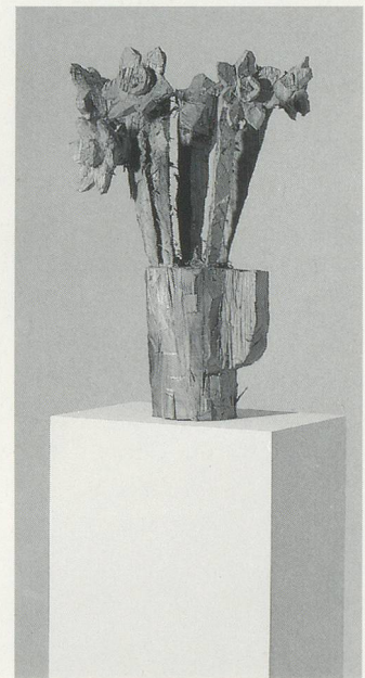
STEPHAN BALKENHOL, OSTERGLOCKEN, 1989, Zedernholz, Höhe 48 cm / DAFFODILS, 1989, cedar wood, 18 7/8".