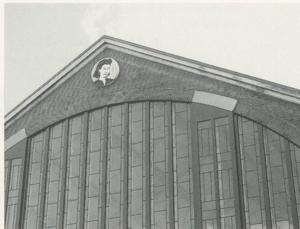
STEPHAN BALKENHOL, GROSSES KOPFRELIEF , 1993, Pappelholz gefasst, Installation im Giebel der Deichtorhallen, Hamburg / BIG HEAD RELIEF , 1993, polychromed poplar wood, installation in the gable, Deichtorhallen, Hamburg, exhibition Post Human.

venture to say that he has succeeded in rendering this consensus with an excellence that borders on the miraculous.