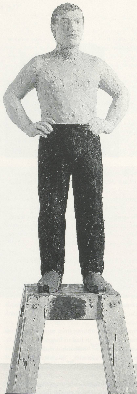
STEPHAN BALKENHOL, MANN MIT SCHWARZER HOSE, 1987, Rotbuche gefasst, 205 cm / MAN IN BLACK TROUSERS, 1987, polychromed red beech wood, 80 \frac{3}{4} ".

1) From the exhibition catalogue, Possible Worlds (London: ICA and Serpentine Gallery, 1992).