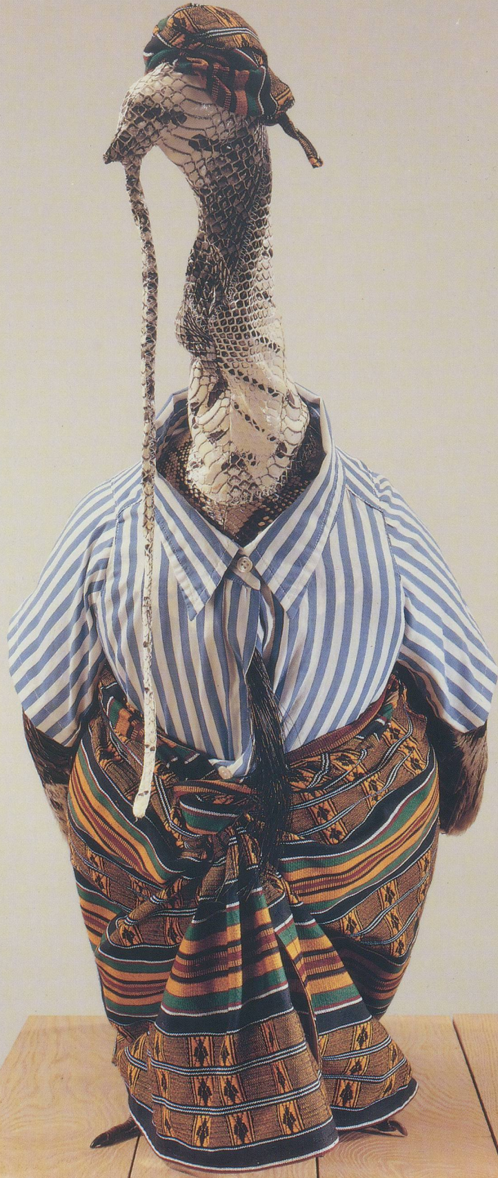
MEYER VAISMAN, UNTITLED TURKEY XV, 1992, snakeskin, fabric, stuffed turkey and mixed media on wood base, 30 x 32 x 14" (bird) / TRUTHAHN OHNE TITEL XV, 1992, Schlängenhaut, Stoff, ausgestopfter Truthahn und Mixed Media auf Holzsochel, 76 x 81 x 36 cm (Vogel).