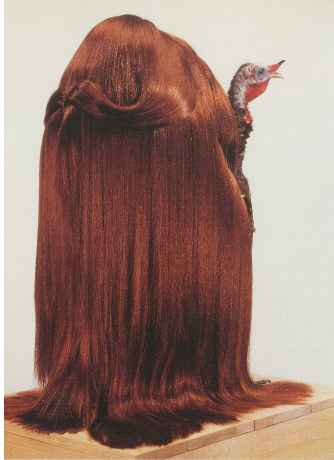
MEYER VAISMAN, UNTITLED TURKEY XVI (Peg) , 1992, synthetic hair, steel wire, bobby pins, stuffed turkey and mixed media on wood base, 33 x 28 x 14" (bird) / TRUTHAHN OHNE TITEL XVI (Peg) , 1992, synthetisches Haar, Stahldraht, Haarklammern, ausgestopfter Truthahn und Mixed Media auf Holzsockel, 84 x 71 x 36 cm (Vogel).

scheinbar nichtsnutzigen Absicht, komödiantische Elemente in die Kunst einzuführen. Im wirklichen Leben werden menschliche Schwächen verständlich, wenn uns irgendein anderes armes Schwein mit seinem Glück oder Unglück zum Lachen bringt. Ist ein Schuss Glück nicht besser als Missgeschick und Unsicherheit? Dagegen hat die kulturelle Elite wenig übrig für Humor in der Kunst, und im kunsthistorischen Kanon kommen Maler und Bildhauer, die man vor allem wegen ihres entspannten Humors schätzt, selten vor. Duchamp ist nahe dran, aber dann wird sein Humor gleich wieder «ernst» und très français . Goya ist die bewährte Ausnahme: ein Künstler, dessen humorvoll-satirische Graphik gleichberechtigt neben seiner Malerei steht. Vaisman schnüffelt gern