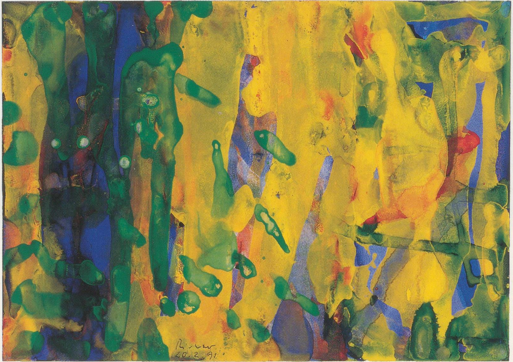
GERHARD RICHTER, 20.2.91, Aquarell auf Papier, 24 x 33,8 cm / 2/20/91, aquarelle on paper, 9 1 / 2 x 13 3 / 8 ". (PHOTOS: GEORGE MEISTER)