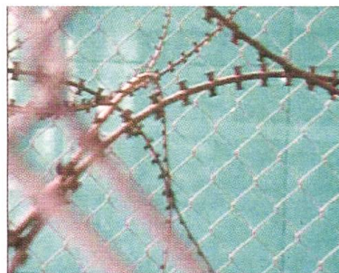
o.T. • Pascal Werner Die Schönheit des gemeinen Stacheldrahtes. The beauty of common barbed wire.