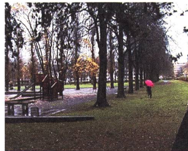
Golf 5 • Philipp Berkowitsch & Stefano Garbani

Ein roter Schirm wird zum Messgerät für die Raamtiefe im zweidimensionalen Bild. A red umbrella becomes a gauge for spatial depth in a two-dimensional image.