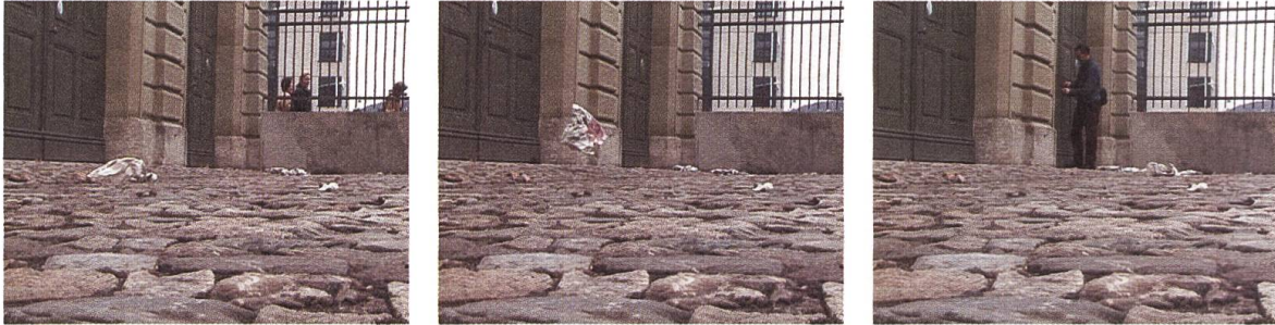
-----> • Alexandra Ciardo / Serdar Eyiz Eine oral history der urbanen Orientierung. An oral history of urban orientation.