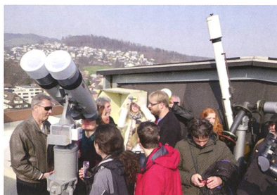
Abbildung 1: Volle Terrasse.

Da die Medien im Vorfeld der bevorstehenden Sonnenfinsternis grosse Aufmerksamkeit schenken, wurde das Interesse vieler geweckt. Eine partielle Sonnenfinsternis ist bei uns nicht so oft zu sehen und verdient diese Aufmerksamkeit. Und da die Wetterprognosen für einmal hervorragend waren, stand dem grossen Spektakel nichts mehr im Weg. Ich ahnte schon, dass wir am 20. März in der Sternwarte Hubelmatt von den interessierten Kindern und Erwachsenen überrannt werden würden. Auch wurden wir informiert, dass sich Radio und Fernsehen bei uns einfinden wird, um zu berichten. Glücklicherweise hatten wir am Tag des Geschehens nebst den drei freiwilligen Demonstratoren, noch weitere fachkundige Vereinsmitglieder auf dem Platz, welche halfen, den Andrang zu bewältigen.