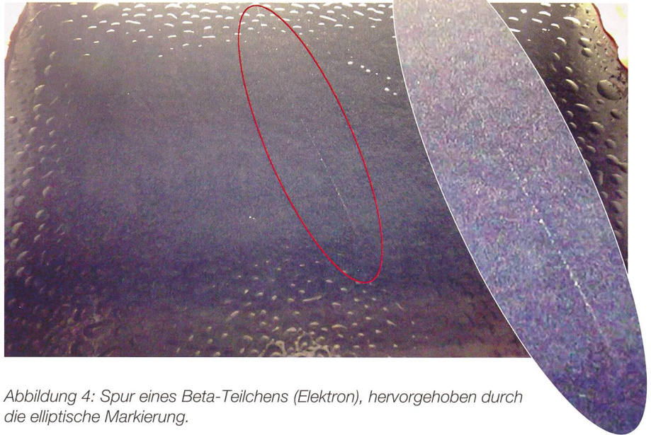
Abbildung 4: Spur eines Beta-Teilchens (Elektron), hervorgehoben durch die elliptische Markierung.