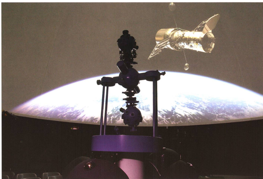
Abbildung 2: Die Fulldome-Projektion mit QUINTO.

scherte dem Sternprojektor ein stattliches Alter. Noch tut er seinen Dienst, projiziert 5'000 Sterne in die 8-Meter-Kuppel und kann immerhin Sonne, Mond und 5 Planeten durch den Himmel fahren lassen. Und das alles in einer optisch beeindruckenden Klarheit.