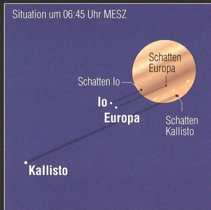
Abbildung 1: Die Geometrie der Schattenschwürfe am Morgen des 12. Oktobers 2013. (Grafik: Thomas Baer)

Zu Monatsbeginn sehen wir den abnehmenden Mond in der Morgendämmerung, ein allerletztes Mal am 3. Oktober 2013 gegen 06:45 Uhr MESZ, als schmale Sichel 43¼ Stunden vor Neumond rund 10° über dem Ostsüdosthorizont. Zwei Tage später zieht der Erdtrabant an der Sonne vorbei und taucht erstmals am 6. Oktober 2013, allerdings knapp über dem Westsüdwesthorizont, wieder auf. Die abendliche Ekliptik verläuft recht flach. Das Erste Viertel wird am 12. Oktober 2013 im Sternbild des Schützen erreicht. In der Nacht vom 18. auf den 19. Oktober 2013 verzeichnen wir Vollmond, begleitet von einer Halbschatten-Mondfinsternis. Das Letzte Viertel fällt auf den 27. Oktober 2013. Drei Tage später zieht der Mond an Mars vorbei. (Red.)