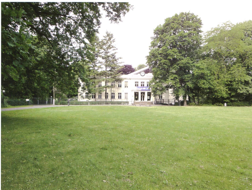
Abbildung 2: Die Archenhold-Sternwarte steht heute am Rand des Treptower Parkes – einer beeindruckenden und ausgedehnten Grünlandschaft mitten in der pulsierenden Grossstadt Berlin.

ARCHENHOLD verliess im 70. Altersjahr die Sternwarte und übergab sein Lebenswerk seinem Sohn und Fachastronomen JÜRGEN. Doch der junge ARCHENHOLD, der in Zürich promoviert hatte, geriet bald in den Rassen-Wahn der Nazis, musste um sein Leben fürchten und verliess so mit seiner Familie 1936 fluchtartig sein Heimatland. Nach dem Krieg wurde die ARCHENHOLD-Sternwarte im Zuge der Bildungsanstrengungen der DDR-Führung ausgebaut und mit weiteren Instrumenten im weitläufigen Garten ausgestattet. Der grosse Refraktor ist heute nach wie vor funktionstüchtig, wovon sich die Tagungsteilnehmer am Freitagabend mit Saturn-Beobachtungen persönlich überzeugen konnten. Auch der Bau des Zeiss-Gross-Planetariums am Prenzlauer Berg war ein Abenteuer. Dass das Planetarium wirklich einem Bedürfnis entsprach, zeigten die 300'000 Besucher alleine im ersten Betriebsjahr. Und auch in den Folgejahren blieben die Besucherzahlen hoch. Doch das änderte sich mit der Wende drastisch. Sowohl die Archenhold-Sternwarte als auch das Grossplanetarium waren in den letzten Jahren lange Zeit ernsthaft von der Schliessung bedroht.