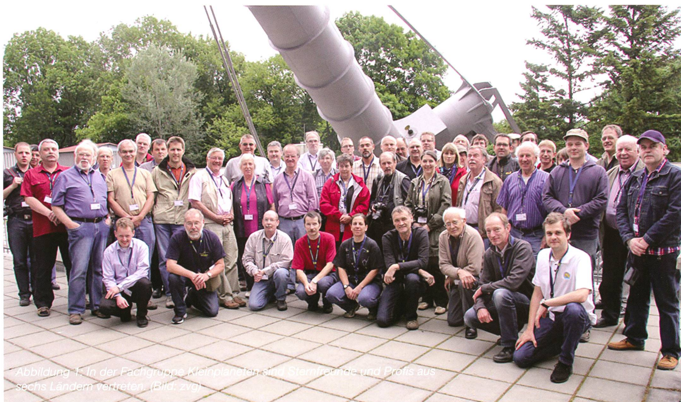
Abbildung 1: In der Fachgruppe Kleinplaneten sind Sternfreunde und Profis aus sechs Ländern vertreten.

Über eine faszinierende Sternbedeckung durch den Asteroiden (44) Nysa berichtete im dritten Referat der holländische Sternfreund HARRY RUTTEN. Er beobachtete das Ereignis am 20. März 2012 mit seinem 14-Zoll-Meade und einer Watec-Videokamera, wobei der 10 Magnituden helle Stern bei der Bedeckung noch