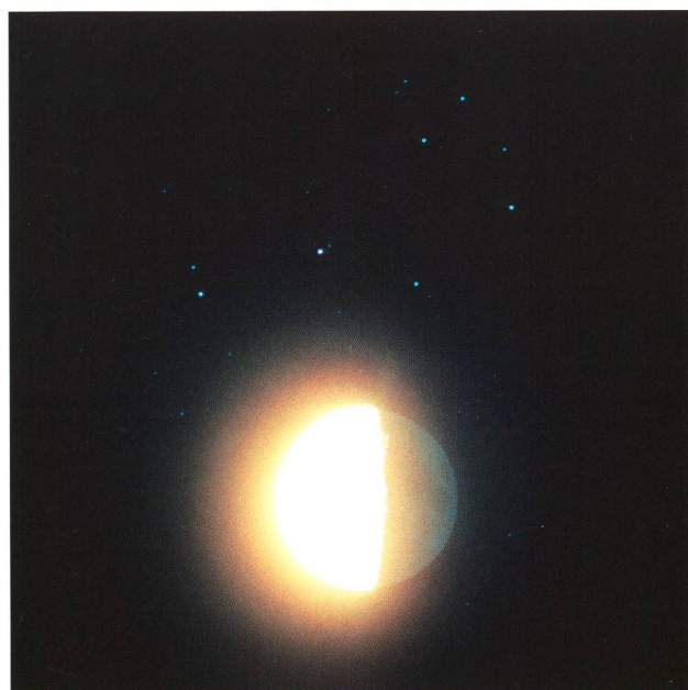
Abbildung 3: Naher Vorübergang des Mondes an den Plejaden am 1. September 1991. Pentax 200mm-Objektiv bei f2.8; 30 Sekunden auf Kodachrome 64. Trotz des mehr als halbvollen Mondes ist das Erdlicht erkennbar.

Noch vor einem Jahrzehnt waren analoge Aufnahmen auf feinkörnigen, aber auch niedrig empfindlichen Film bei Mond- und Planetenaufnahmen die Norm. Bei den gezeigten Bildern von Plejadenbedeckungen (Abbildungen 2 und 3) kam der legendäre Kodachrome 64 zum Einsatz. Die Bilder sind Ausschnittsvergrösserungen von Aufnahmen mit einem 200mm-Teleobjektiv mit einem Öffnungsverhältnis (Maximalblende) von 2.8. Bild 2 wurde länger belichtet als Bild 3, um das Erdlicht gut sichtbar zu machen. Trotz der relativ geringen Brennweite der Optik machte sich während der zweiminütigen Belichtungszeit die relative Bewegung des Mondes bemerkbar (nachgeführt wurde mit siderischer Rate, also auf die Sterne). Man kann die leichte Unschärfe des Mondes also als «Bewegungsunschärfe» deuten, die durch die Umdrehung um die Erde zustande kam. Mit modernen digitalen Spiegelreflexkameras sind bei guter Nachbearbeitung und Verwendung des RAW-Formats Empfindlichkeitseinstellungen bis weit über 1000 ASA möglich, wodurch Probleme mit der Mondbewegung weitgehend vermeidbar sind (vergleiche zur Bearbeitung von RAW-Daten den Beitrag in Orion 371, «Astro-Landschaftsfotografie mit Ultraweitwinkel-Objektiven»). Bilder von Plejadenbedeckungen gelingen bei grossen Phasenwinkeln des Mondes besser, also kurz