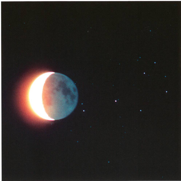
Abbildung 2: Ende der Bedeckung der Plejaden durch den Mond, 18. Juli 1990. Pentax 200mm-Objektiv bei f2.8; 120 Sekunden auf Kodachrome 64. Der Mond hat sich während der Belichtungszeit merklich gegenüber den Sternen verschoben.

ihn zu beschneiden; bei kleineren Sensoren vermindert sich die Maximalbrennweite entsprechend. Selbstverständlich sind auch Aufnahmen bei weitaus längeren Brennweiten möglich, doch haben dann nicht mehr beide Himmelskörper gesamthaft Platz.