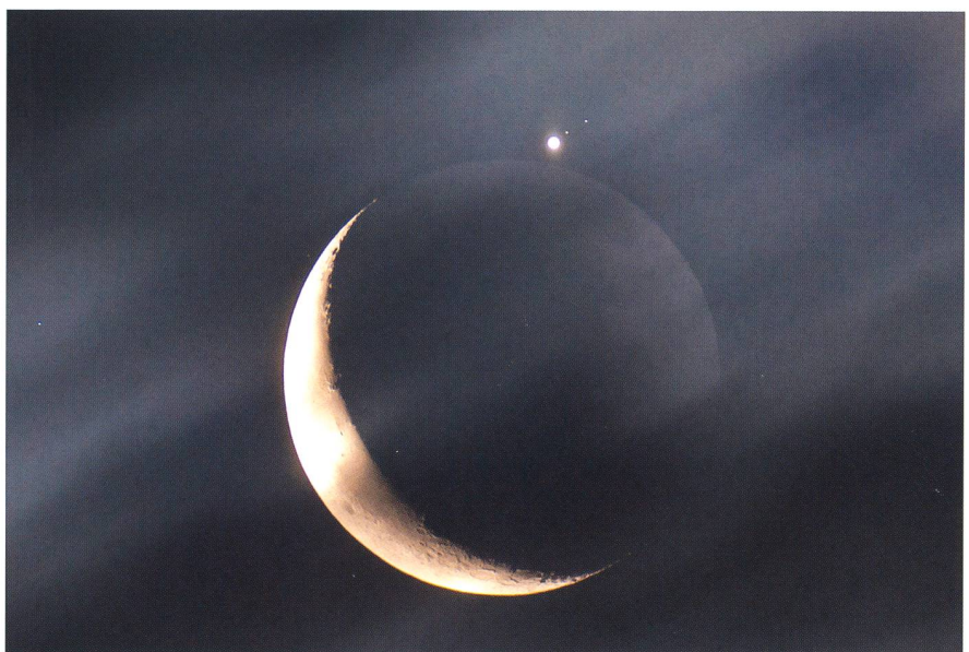
Abbildung 8: Nach dem Bedeckungs-ende Jupiters am 15. Juli 2012 um 04:22 Uhr MESZ, 5 s bei 1250 ASA. Neben Jupiter Europa und Io (näher beim Planeten). Durch die lange Belichtungszeit wirkt sich die Bewegung der Wolken bildwirksam aus.

■ Dr. Jürg Alean Rheinstrasse 6 CH-8193 Eglisau jalean@stromboli.net