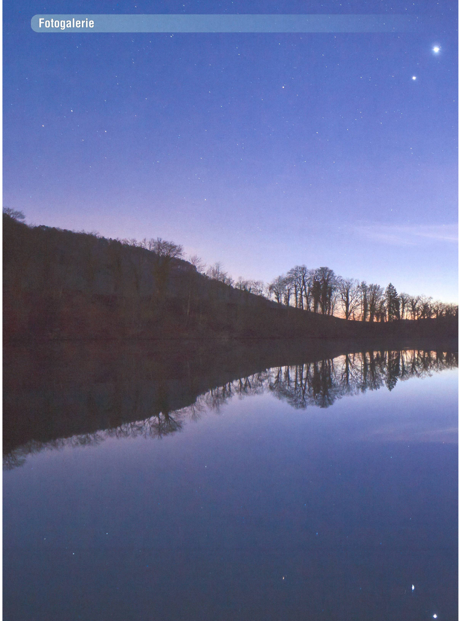
Bild: Venus und Jupiter spiegeln sich im Rhein bei Eglisau, ZH.