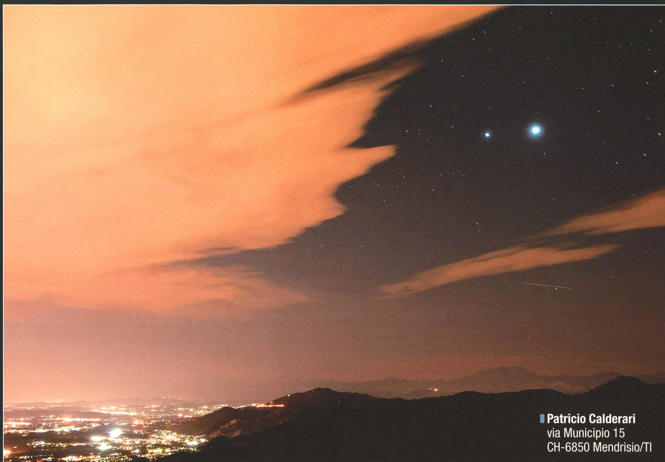
■ Patricio Calderari via Municipio 15 CH-6850 Mendrisio/TI

mit einem entgegenkommenden Flugzeug zu kollidieren und daraufhin einen abrupten Sinkflug einleitete. Zahlreiche, nicht angegurte Passagiere wurden aus ihren Sitzen geschleudert und mussten nach der Landung in Zürich mit leichten Verletzungen in ärztliche Behandlung gebracht werden.