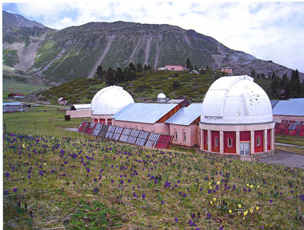
Abbildung 1: Das Observatorium in den Tian Shan Bergen.

Der folgende Bericht beschreibt ein einzelnes Element aus dem 2007 gestarteten internationalen Projekt IHY2007 (International Heliophysical Year 2007) der Vereinten Nationen. A. O. BENZ hat in der ORION-Ausgabe 341 darüber berichtet. Inzwischen werden die Projekte unter der Bezeichnung ISWI (International Space Weather Initiative) durch die UN und die NASA zur Förderung von Entwicklungsländern weiter geführt und politisch gefördert. In meinem Fall hat die SSAA (Swiss Society for Astrophysics and Astronomy) das Projekt finanziell unterstützt.