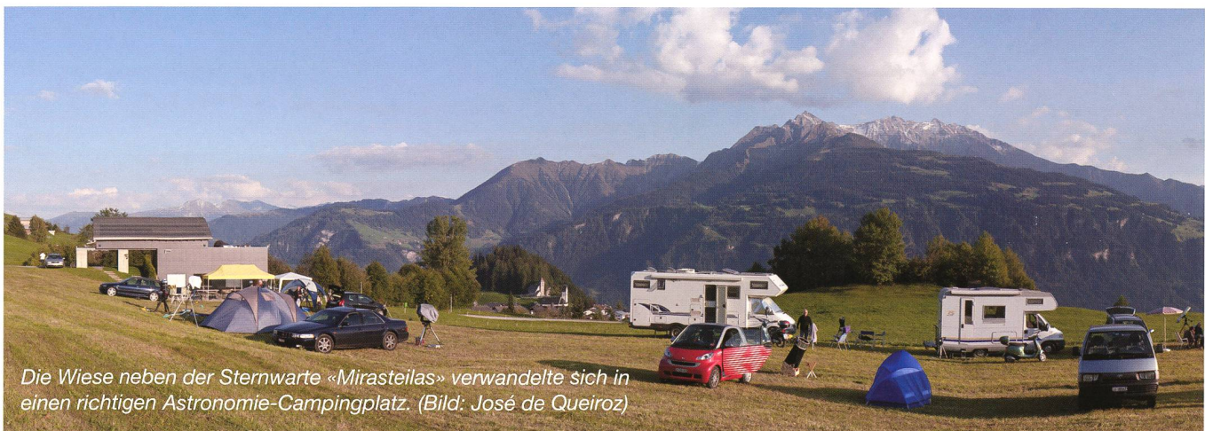
Die Wiese neben der Sternwarte «Mirasteilas» verwandelte sich in einen richtigen Astronomie-Campingplatz.