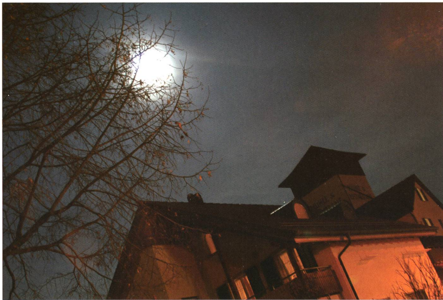
Was stört mehr? Das natürliche Licht des Vollmondes oder die grelle Strassenlaterne vor dem Schlafzimmerfenster, die ganze Hausfassaden erhellt?

Sind Sie mondfühliger oder glauben es zu sein? – Die Frage nach dem Einfluss des Mondes auf Menschen und Pflanzen ist ein heikles Pflaster: Wer daran glaubt, den kann man kaum mit fundierten Fakten überzeugen. Dennoch gibt es viele wissenschaftliche Untersuchungen, die belegen, dass wir bei Vollmond nicht schlechter schlafen als an anderen Tagen.