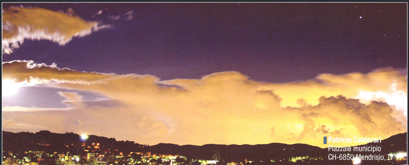
Patricio Calderari Piazzale municipio CH-6850 Mendrisio, TI

Wolken gab es auch südlich von Barnaul in Russland, wo es am 1. August 2008 zu einer totalen Sonnenfinsternis kam. Bis zur letzten Minute zitterte die Reisegruppe, ob die Sonnenkorona sichtbar würde. Nur 10 km weiter südlich versteckte sich die Sonne komplett hinter dem Gewölk.