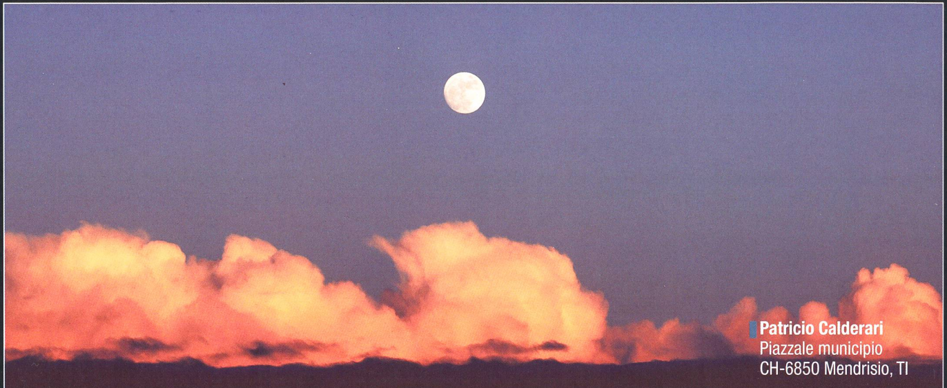
Patricio Calderari Piazzale municipio CH-6850 Mendrisio, TI