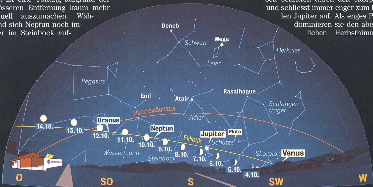
Anblick des abendlichen Sternenhimmels Mitte Oktober 2008 gegen 19.45 Uhr MESZ (Standort: Sternwarte Büllach)

In der unteren Grafik ist Venus gegen 19:45 Uhr MESZ eben im Südwesten untergegangen. In der Abenddämmerung setzt sie sich aber immer besser als «Abendstern» in Szene und wandert in grossen Schritten durch den Skorpion und schliesst immer enger zum hellen Jupiter auf. Als enges Paar dominieren sie den abendlichen Herbsthimmel.