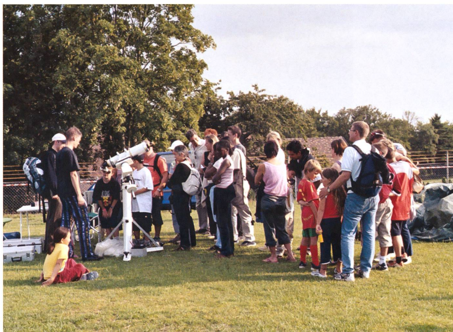
La Féerie d'une Nuit est une manifestation publique. Chaque année avant les grandes vacances d'été beaucoup de gens intéressés à l'astronomie se rencontrent dans le Parc «Signal de Bougy».

Qu'est-ce que Féerie d'une Nuit? Organisée par une association à but non lucratif, notre manifestation a pour but de faire découvrir notre univers à tous ceux, petits et grands, qui s'intéressent de près ou de loin à l'astronomie.