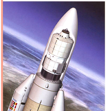
Der unbemannte Weltraumfrachter «Jules Verne» wurde durch eine Ariane-5 ES in den Orbit gebracht.

Um das «Automated Transfer Vehicle» ATV, genannt «Jules Verne» – mit beinahe 20 Tonnen mehr als doppelt so schwer wie die letzte von einer Ariane-5 gestartete Nutzlast – auf seine 51,6 Grad gegen den Äquator geneigte Kreisbahn zu bringen, war eine neue Ausführung von Europas Schwerlastträger Ariane-5 erforderlich. Die speziell auf den ATV-Start zugeschnittene Ariane-5 ES wurde mit einer besonderen, erneut zündbaren Oberstufe ausgestattet.